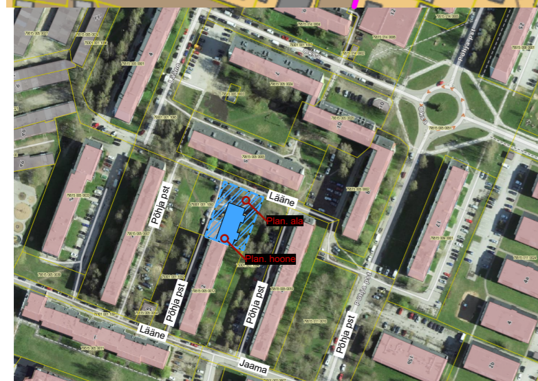
Aluskaart: Maa-amet 2022