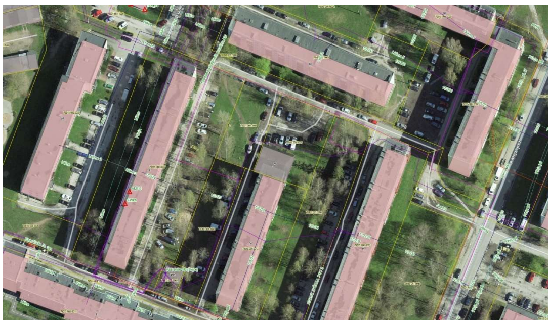
Maa-ameti geoportali väljavõte olemasolevast olukorrast 01.04.22, M 1:500