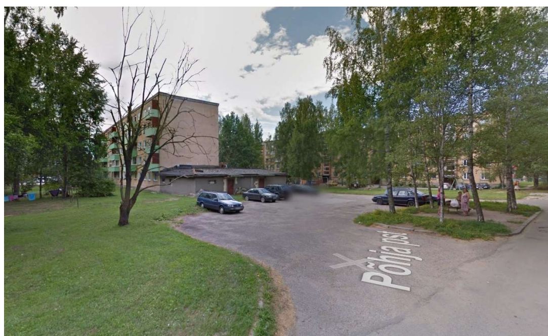
Google street view väljavõte olemasolevast olukorrast juuli 2014