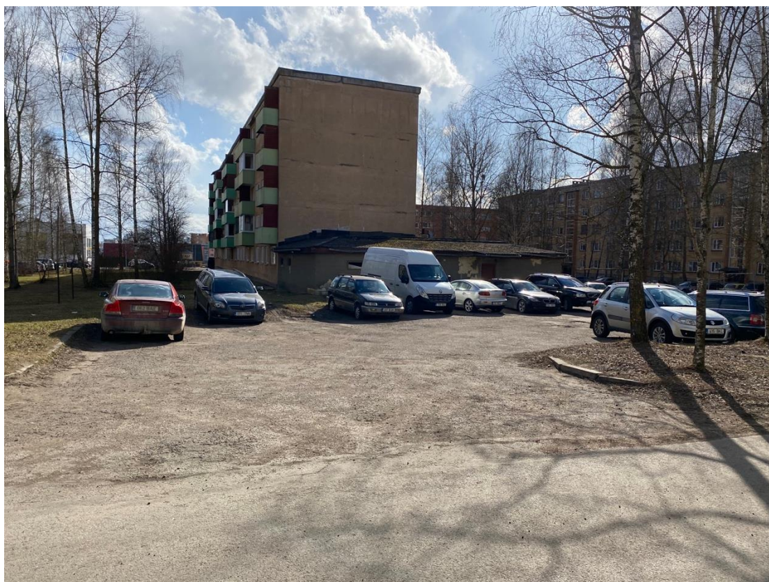
Foto 1. Vaade planeeringualale Lääne tänavalt.

Olemasolev olukord on graafiliselt nähtav joonisel nr 1 ja alloleval fotol 1.