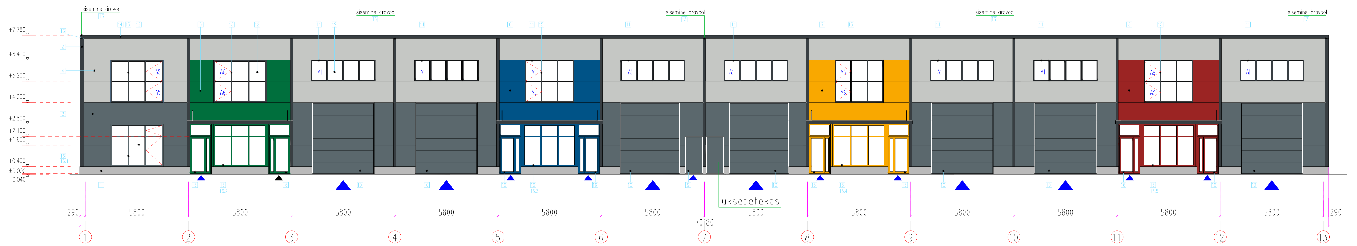
Vaade - A