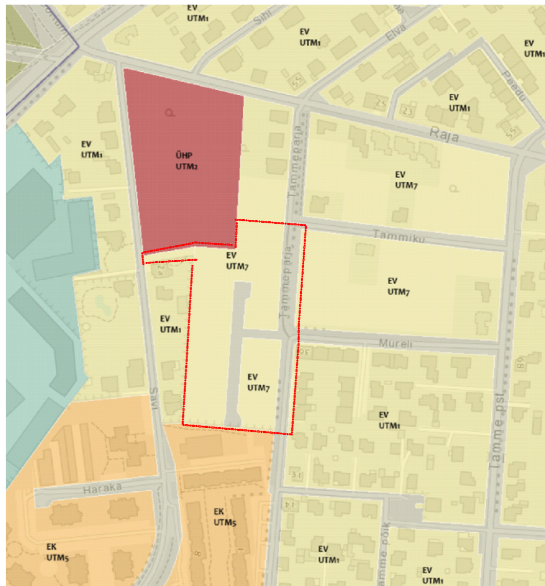
Väljavõte Tartu linna üldplaneeringu maakasutuse joonisest

Ev - väikeelamu maa-ala, EK - korterelamu maa, ÜHP - haridusasutuse maa, UTM - ala ehitustingimuste tähis.