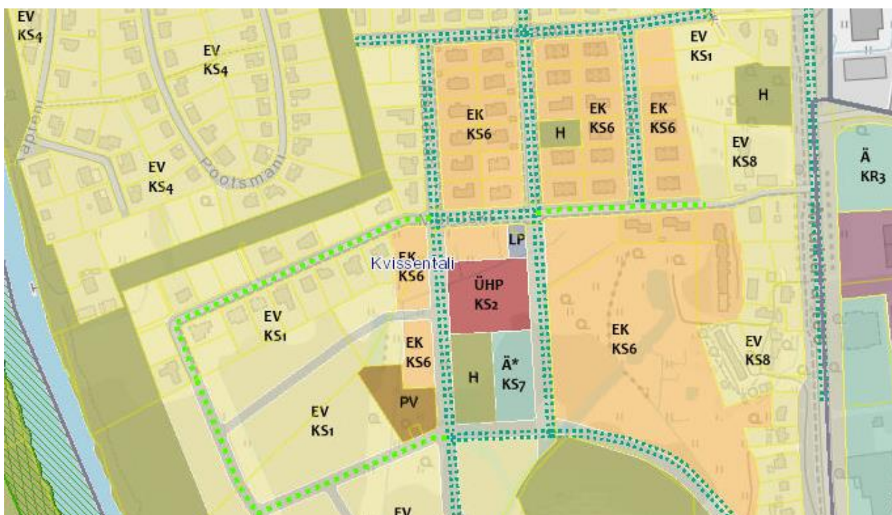
Skeem 2. Väljavõtte Tartu linna üldplaneeringust. Kavandatud tegevus toetab planeeringu kontaktala jätkuvat elamupiirkonnana kujunemist

Detailplaneeringuga realiseeritakse kõrgema taseme strateegiliste planeerimisdokumentidega seatud suunda Kvissentali linnaosa arendamiseks. Tegemist on kortermajade arendusega, mis asub juba väljakujunenud, ent endiselt arenevas elamuala piirkonnas. Kavandatud tegevus toetab planeeringu kontaktala jätkuvat elamupiirkonnana kujunemist, soodustades piirkonnas ka teenuste ja infrastruktuuri edasist arendamist. Planeeringulahenduse elluviimisega kasutatakse ära nii olemasolevat infrastruktuuri kui ka täiendatakse elamuala toimimiseks vajalikku võrgustikku.