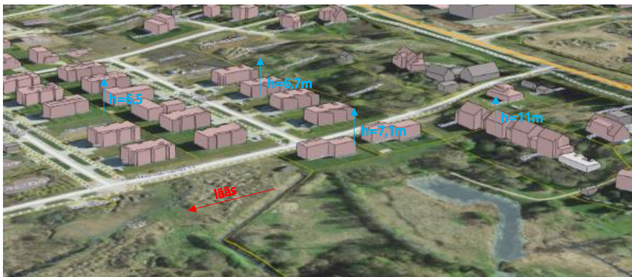
Skeem 1. Väljavõtte Maa-ameti 3D kaardilt ning andmed vastavalt ehitisregistrile.