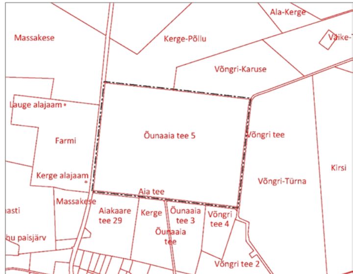
Skeem 3. Ümbritsevad krundid (piirid Maa-amet, 06.10.2021)