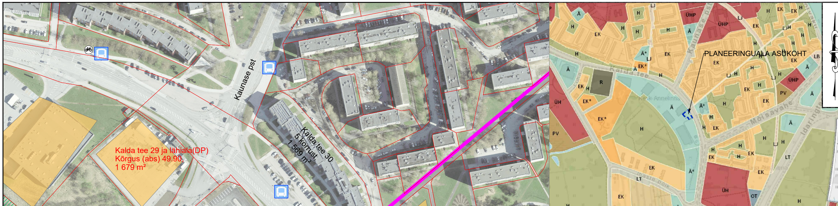
TARTU LINNA ÜLDPLANEERINGU MAAKASUTUSTINGIMUSTE KAARDI VÄLJAVÕTE