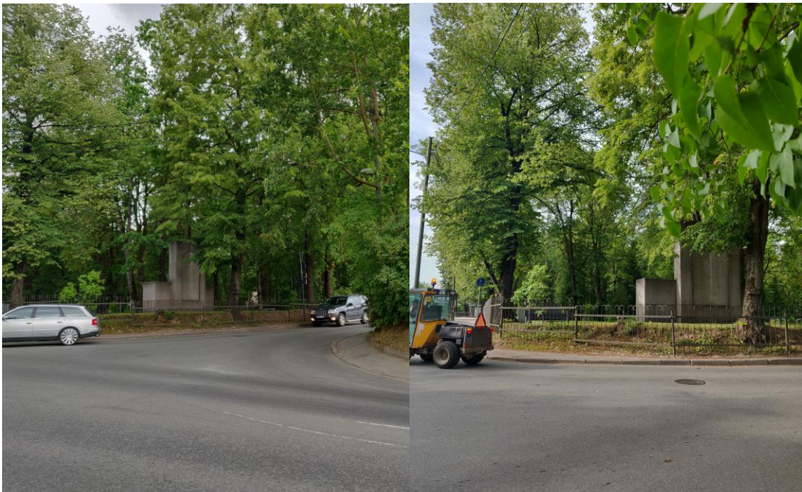
Foto 3. Vaated planeeringualalt Vabadussõja mälestussambale (reg. nr 27169).

Võru tänavalt külgneb planeeringuala tiheda sireli hekiga (foto 4). Kavandatava hoone rajamiseks ning sinna viiva kõnnitee loomiseks tuleb tihe hekk maha võtta ning tänu sellele suureneb vaatekoridor Pauluse surnuaiale ja monumendile.