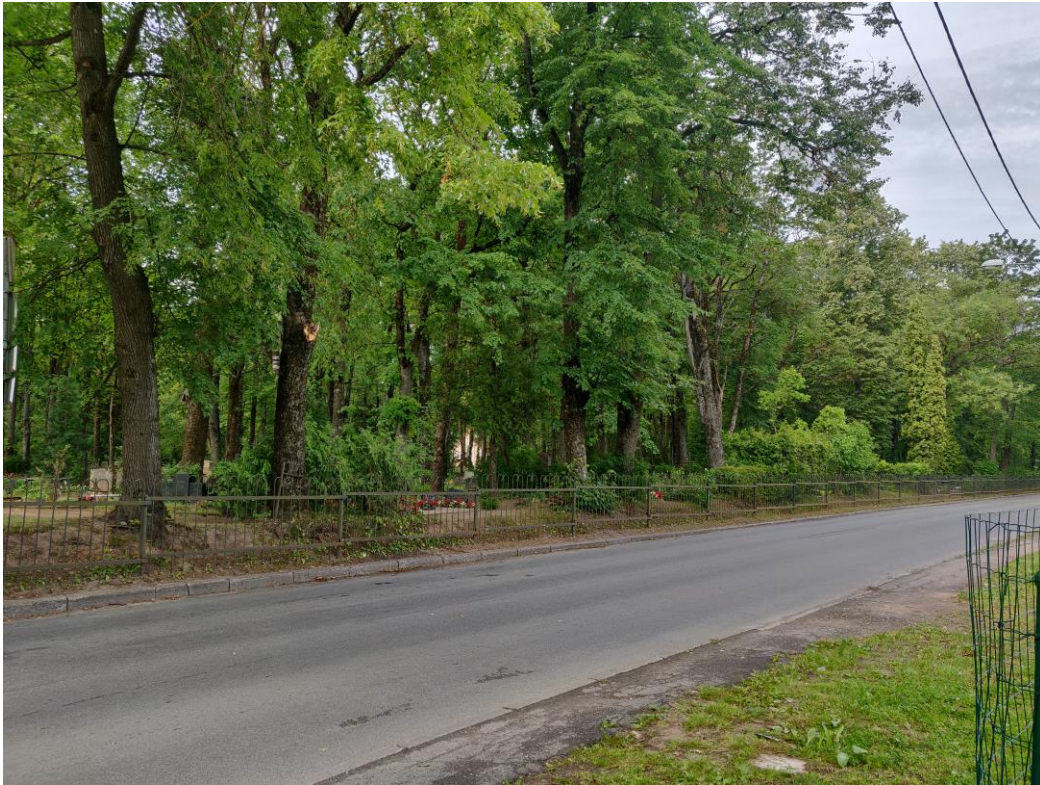
Foto 2. Vaade planeeringualalt Pauluse surnuaiale.