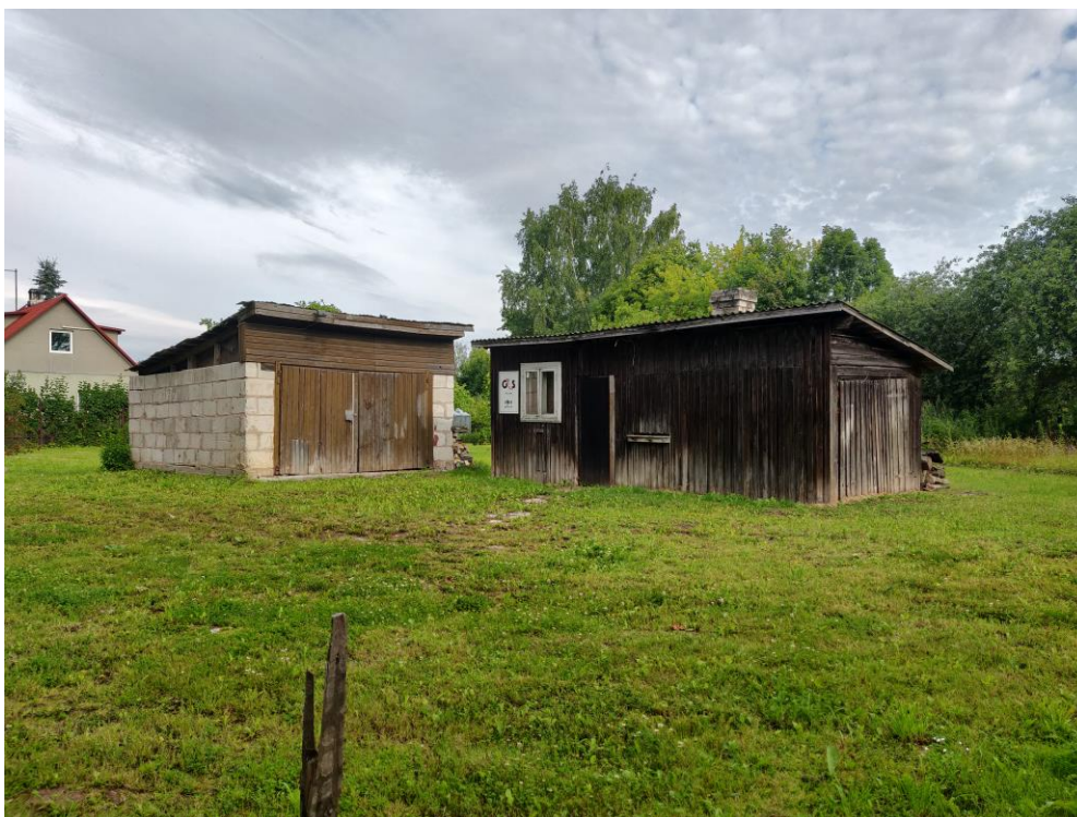
Foto 1. Alal asuvad garaažihoone ning vana saunahoone.

Reljeef planeeringualal on suhteliselt tasane, kõrgused jäävad vahemikku 57.31-57.82. Ainult külgnev Võru tänav asub ca 2 m madalamal ning sellest tulenevalt asub planeeringuala ida servas ka maapinna astang. Ala on kaetud põhiliselt muruga. Planeeringuala läänekülg on piiritletud heki ja traataiaga. Alal asub kolm viljapuud ning põhjaosas ka mõned põõsad. Olemasolevatest hoonetest paikneb planeeringualal vaid üks väike garaažihoone ning vana saunahoone (foto 1). Planeeringualast põhjas ja kirdes paikneb sadamaraudtee koridor, mis asetseb planeeringualaga võrreldes madalamal tasapinnal.