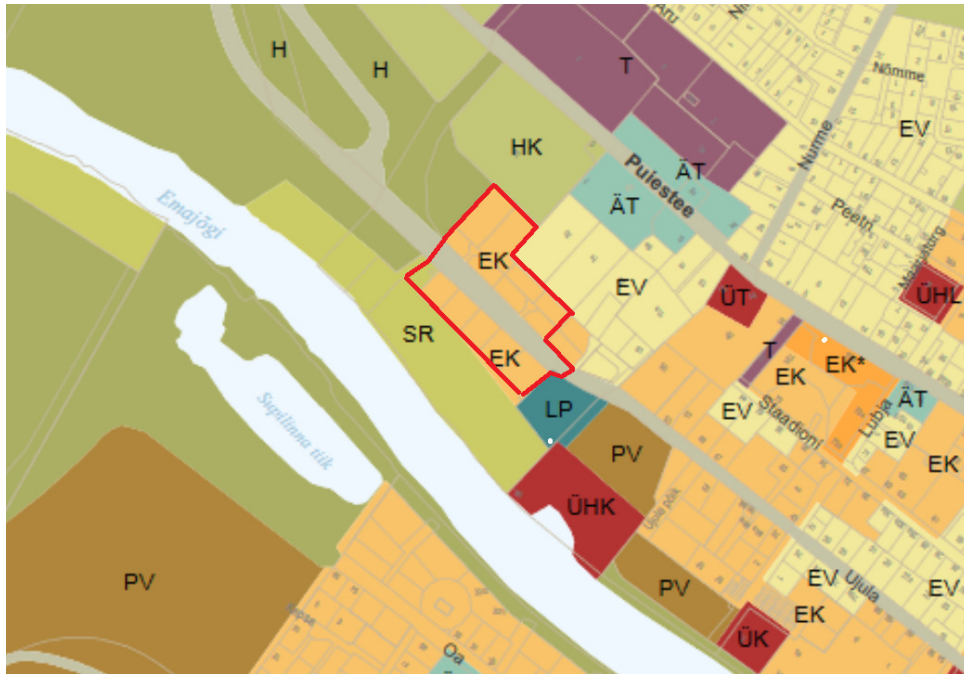
Skeem 1. Väljavõtte Tartu linna üldplaneeringu juonisel 2 Maa- ja veealade üldised kasutamistingimused. Planeeringuala on tähistatud punase joonega. EK tähistab korterelamu maa-ala, EV väikeelamu maa-ala, SR supelranna maa-ala, HK kalmistu maa-ala ja H roheala (looduslik maa-ala ja haljasala), LP parkimisehitise maa-ala.