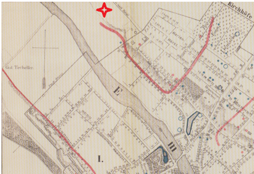
Skeem 3. Väljavõte Laakmanni trükitud plaanist 1889 7 , mälestise tulevane asukoht on tähistatud punase tähekesega.