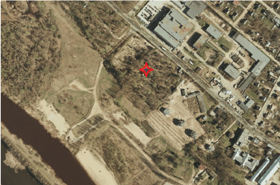
Skeem 6. Väljavõte 2003 ortofotost 12 , mälestise asukoht tähistatud punase tähekesega.

Kalmistule avanevad vaated Puiestee tänavalt. Kuna peavärav ja valvurimaja asuvad otse tänava ääres, on need hästi vaadeldavad; kalmistu kabel jääb kõrghaljastuse varju ja pole tänavalt hästi vaadeldav. Tänu läbi nähtavale puitlippaiale on Puiestee tänavalt vaadeldavad ka hauad, hauatähised, teedevõrk ja haljastus. Seevastu Ujula tänavalt näib kalmistu pargialana, kuna jääb tänavast oluliselt kõrgemale tasapinnale ja asub tänavast kaugel.