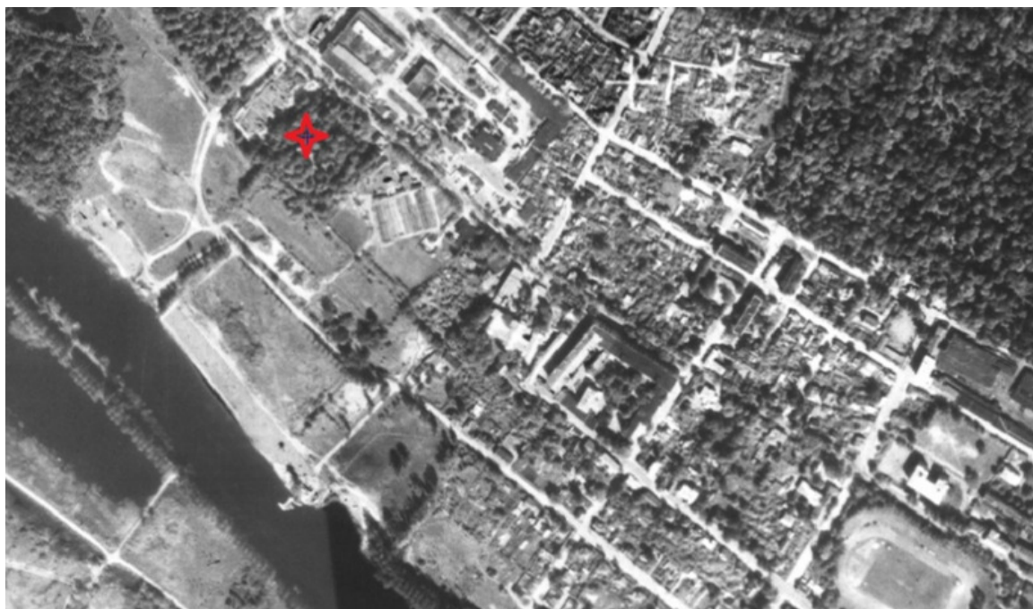
Skeem 5. Väljavõte 1995 ortofotost 11 , mälestise asukoht tähistatud punase tähekesega.

Kruntimine teostati ka planeeringualast põhjasuunda jääval kalmistu vahetusse naabruse jääval alal ja seal on planeering realiseerunud, mh on rajatud planeeringukohased teed ja hooned. Muutunud on hoonestuse iseloom: ühe suuremahulise hoone asemele on rajatud mitu väiksemat, mh kalmistu kaitsevõõndisse Puiestee tn 7b katastriüksusel (võrdle skeem 5 ja 6).