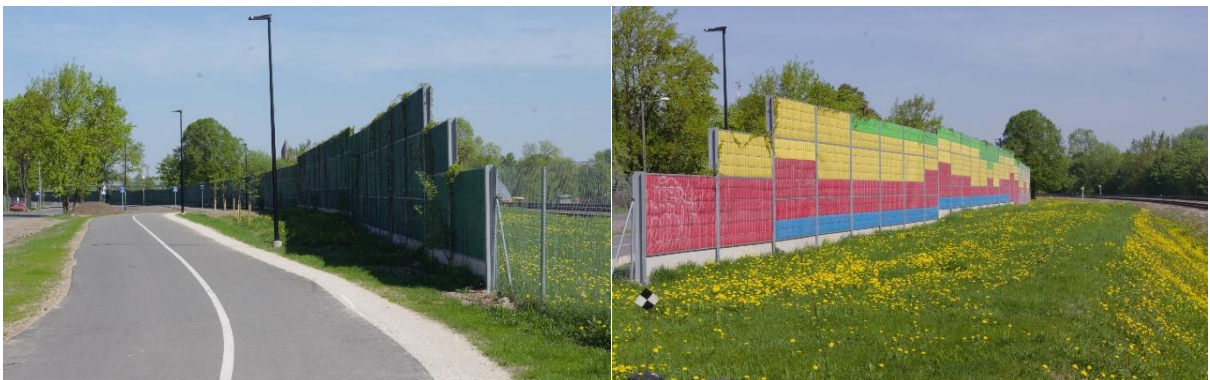
Müratõkke Raudtee tn ääres