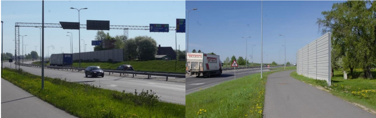
Müratõkked Tartu läänepoolse ümbersõidu ääres (Variku viadukti ja Postimaja liiklussõlme vahel)

Alljärgnevalt on lisatud fotod Tartu linnas rajatud müratõkkeseintest