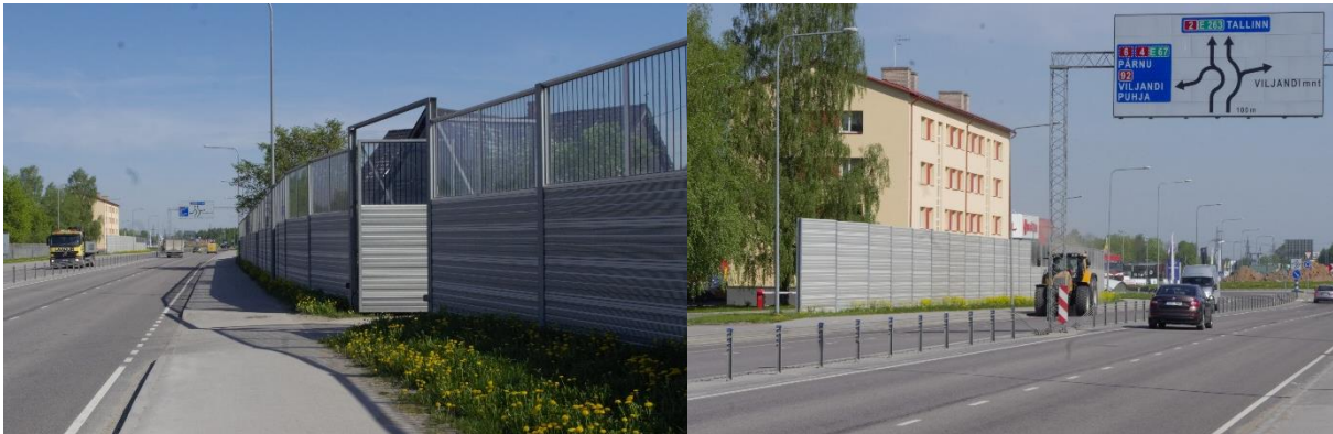
Müratõkked Tartu läänepoolse ümbersõidu ääres (Viljandi mnt ristmiku läheduses)