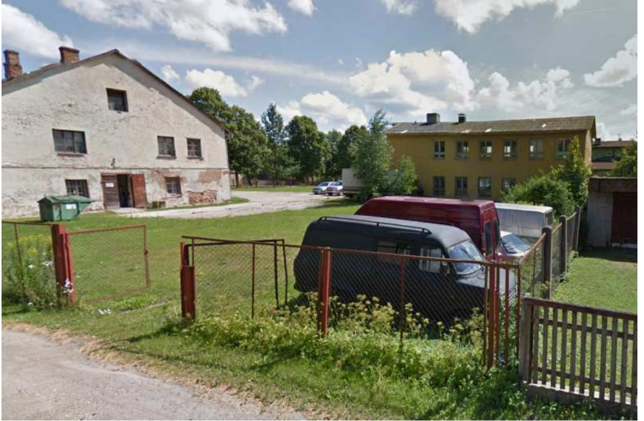
Ave Elken planeerija