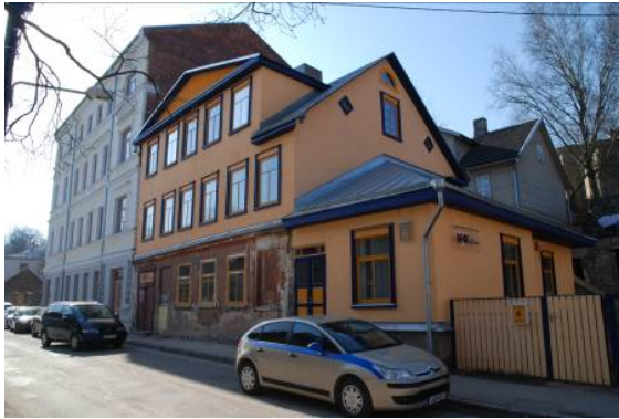
Foto 1. Renoveeritud Tähtvere 6 hoone ja tagapool arhitektuurimälestis Tähtvere 4