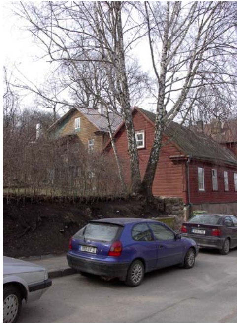
Foto 6. Vaade Tähtvere 14 krundile