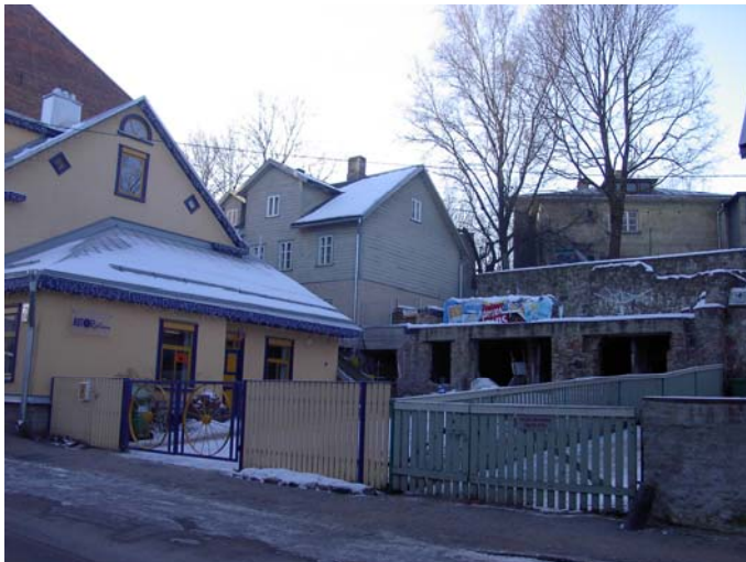
Foto 7. Vaade Tähtvere 6, 8 õuele ( säilinud hoone I korrus ja tulemüüri osad)