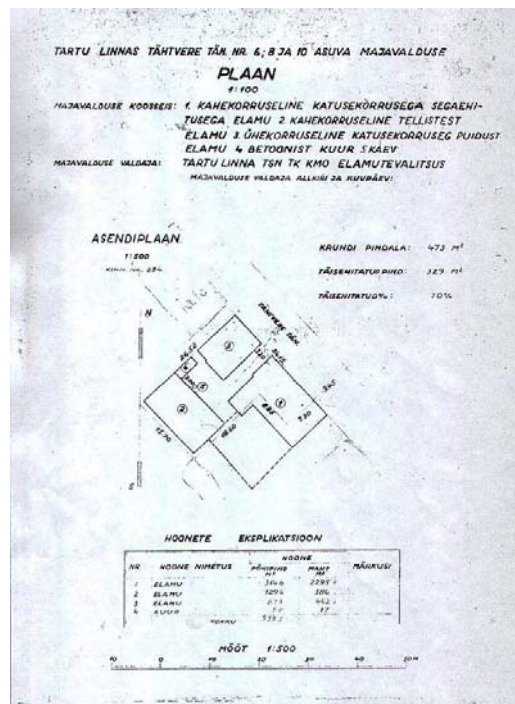
Skeem 2. Krundi plaan 1963.a

Esimene kinnistut käsitlev dokument pärineb aastast 1876, mille järgi paiknesid sellel elu- ja kõrvalhooned: Tähtvere 6 elumaja oli 3-korruseline segaehitus,