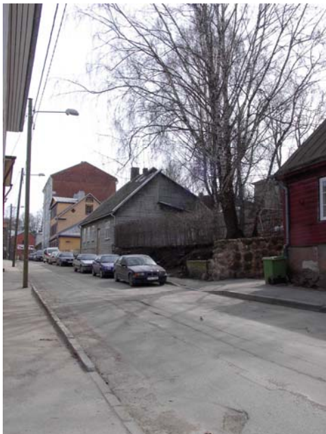
Foto 5. Tähtvere tänava miljöö

Kogu Supilinna miljööväärtusliku hoonestusala piires on säilinud valdavalt algupärane krundistruktuur ja Tähtvere tänava elamud asuvad enam-vähem ühel ehitusjoonel tänava ääres, kuid elumajad asuvad ka paljude kruntide õuealal moodustades nii justkui topelt hoonestuse rea. Korruselisus on 1–3. Piirkonnas on säilinud tänu omaaegsetele puit-ja segaehitusega hoonetele ja õdusatele siseõuedele nn oma aja hõng.