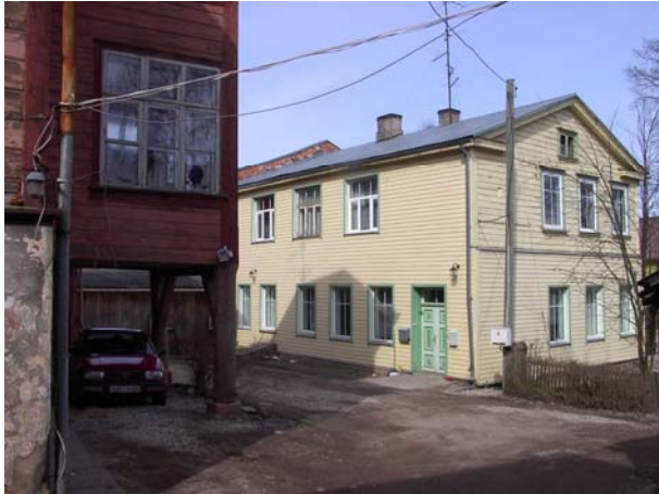
Foto 4 . Ühe siseõue miljöö Tähtvere tänavalt

Peale nende majade asus krundil veel kivist pesukoda ja puidust kuurid. Tähtvere 10 elumaja ja kõrvalhooned säilinud ei ole. Tähtvere tänava maa-ala oli krundistatud ning ilmselt ka hoonestatud juba 18. saj keskpaigast. Kogu Tähtvere mõisa ümber tekkinud eeslinn liideti Tartu linnaga 1916. aastal ning tänav loeti kuuluvaks esimesse linnaossa