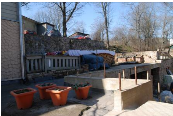
Foto 3. Vaade Tähtvere 8 säilinud hoone osale ülaõuest

Kõrghaljastus krundil puudub, kuid kõrvalkruntidel asuvad puud on haljaks raamistuseks. Madalad ilupõõsad on istutatud tänavaäärse Tähtvere 6 elamu õuepoolse fassaadi ette. Alumise õue osas on võimalik parkida kuni kolm sõiduauto.