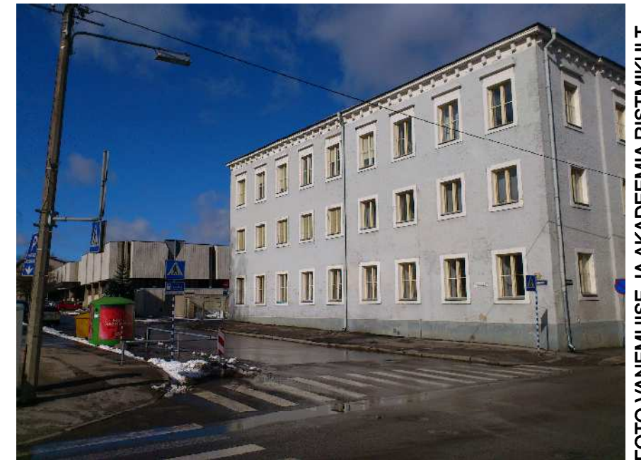
FOTO VANEMUISE JA AKADEEMIA RISTMIKULT