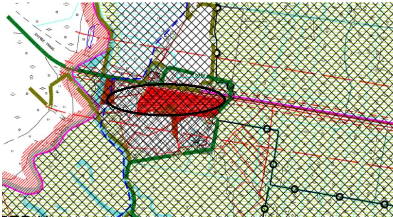
Skeem 3. Väljavõte Tähtvere valla üldplaneeringu põhijoonisest. Planeeringuala orienteeruv asukoht on tähistatud musta ovaaliga.

Hoonete ja rajatiste projekteerimine Emajõe üleujutusala vööndis eeldab üleujutus-sageduse ja -piiride täpsustamiseks teostatud eeluuringuid. Samuti on vajalikud pinnase geotehnilised uuringud. Üleujutusejärgse keskkonnaahu vältimiseks tuleb projekteerida infrastruktuurid (puhasti, puurkaev, teed) üleujutuspiirist kõrgemale. Kämpinguala, Linnutee matkarada, Kärevere karjääri tehishärve, Emajõe sildumisala teenindavad teed ja parklad peavad olema avalikult kasutatavad. Piirkonna planeerimisel tuleb arvestada looduskaitsealade vahetu naabrusega (Alam-Pedja, Kärevere luht) ja Tallinn-Tartu-Võru-Luhamaa põhimaantee kaitsevööndiga, sh maanteest põhjustatud häiringutega (müra, vibratsioon jm).