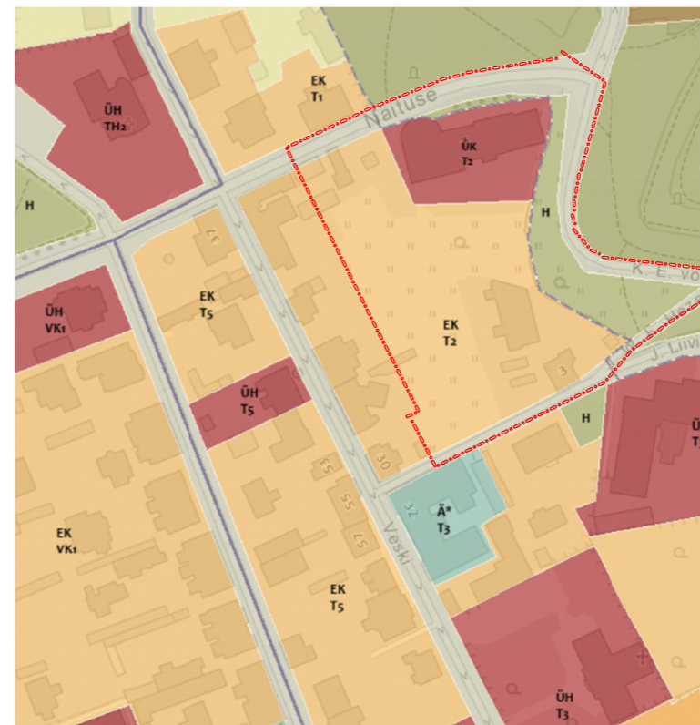
Väljavõte Tartu linna üldplaneeringust