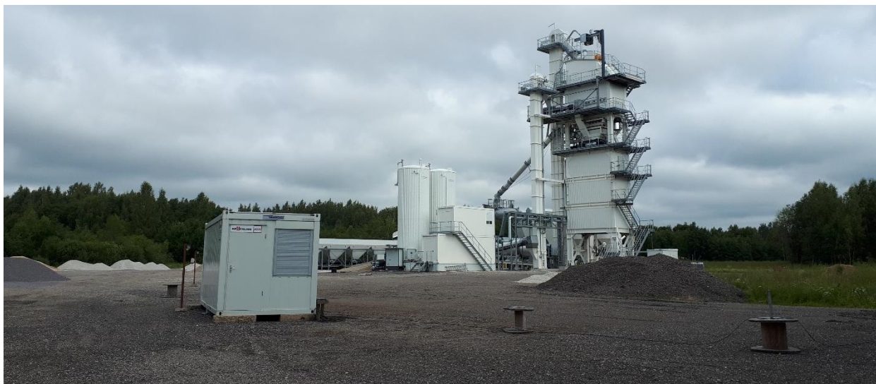
Foto 2. Olemasolev asfaltbetoonisegisti.

Maa-ameti andmetel on tegemist keskmiselt kaitstud põhjaveega alaga (Maa-amet, 19.02.2020).