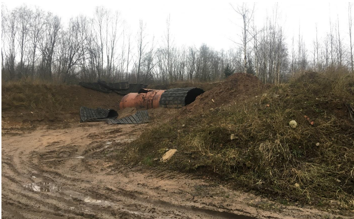
Foto 1. Päästeameti alaline lõhkamiskoht.

Alal on osaliselt säilinud sõjaväepolügooni rajatised (angaarid, kasarmute varemed, laskeavadega betoonist rajatised, laskeharjutusplatsid), millel kasutus puudub. Planeeringuala edelanurgas asub alaline lõhkamiskoht (foto 1), millele on seatud isiklik kasutusõigus Päästeameti kasuks.