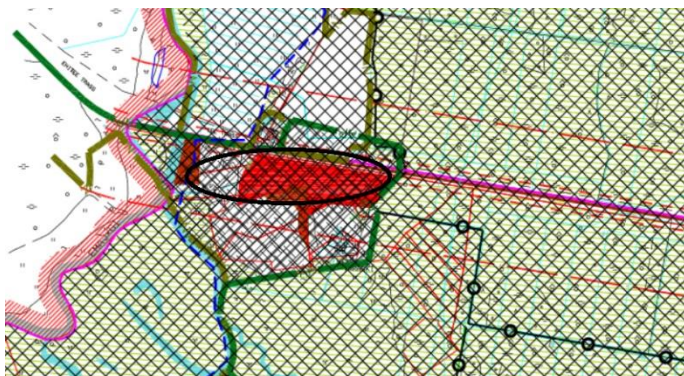
Skeem 3. Väljavõte Tähtvere valla üldplaneeringu põhijoonisest. Planeeringuala orienteeruv asukoht on tähistatud musta ovaaliga.

Hoonete ja rajatiste projekteerimine Emajõe üleujutusala võõndis eeldab üleujutus-sageduse ja -piiride täpsustamiseks teostatud eeluuringuid. Samuti on vajalikud pinnase geotehnilised uuringud. Üleujutusejärgse keskkonnaohu vältimiseks tuleb projekteerida infrastruktuurid (puhasti, puurkaev, teed) üleujutuspiirist kõrgemale. Puhkse- ja virgestusala, Linnutee matkarada, Kärevere karjääri tehisjärve, Emajõe sildumisala teenindavad teed ja parklad peavad olema avalikult kasutatavad. Piirkonna planeerimisel tuleb arvestada looduskaitsealade vahetu naabrusega (Alam-Pedja, Kärevere luht) ja Tallinn-Tartu-Võru-Luhamaa põhimaantee kaitsevööndiga, sh maanteest põhjustatud häiringutega (müra, vibratsioon jm).