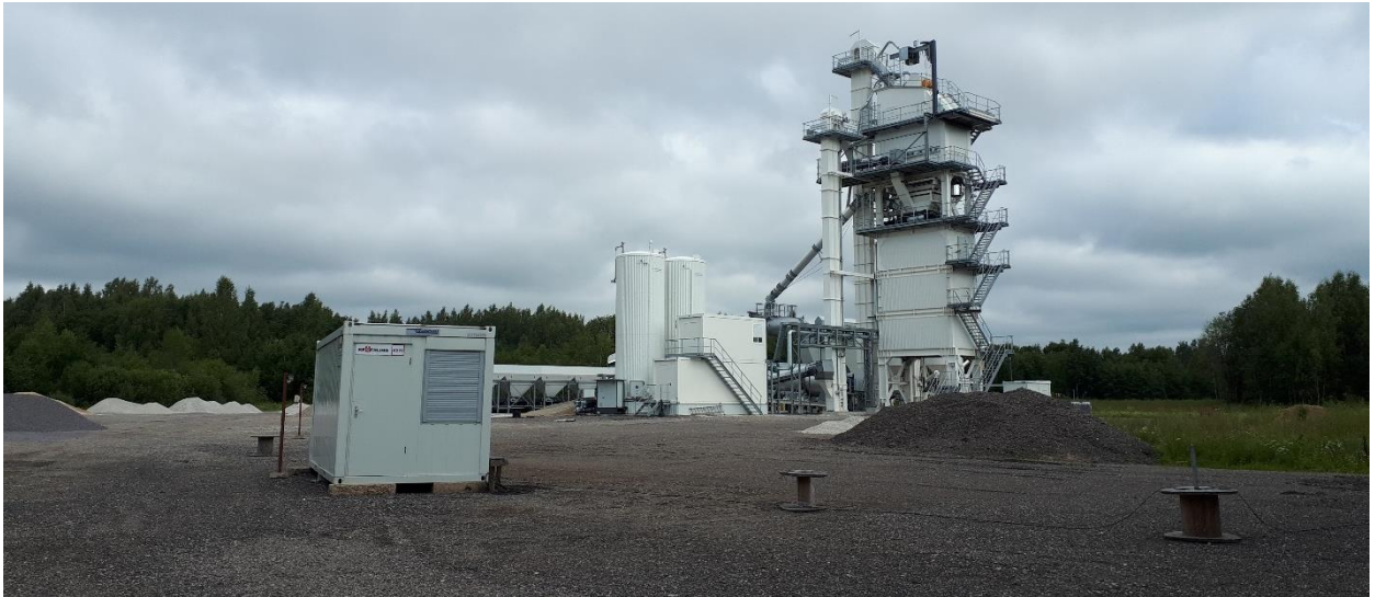
Foto 2. Olemasolev asfaltbetoonisegisti.

Maa-ameti andmetel on tegemist keskmiselt kaitstud põhjaveega alaga (Maa-amet, 19.02.2020).