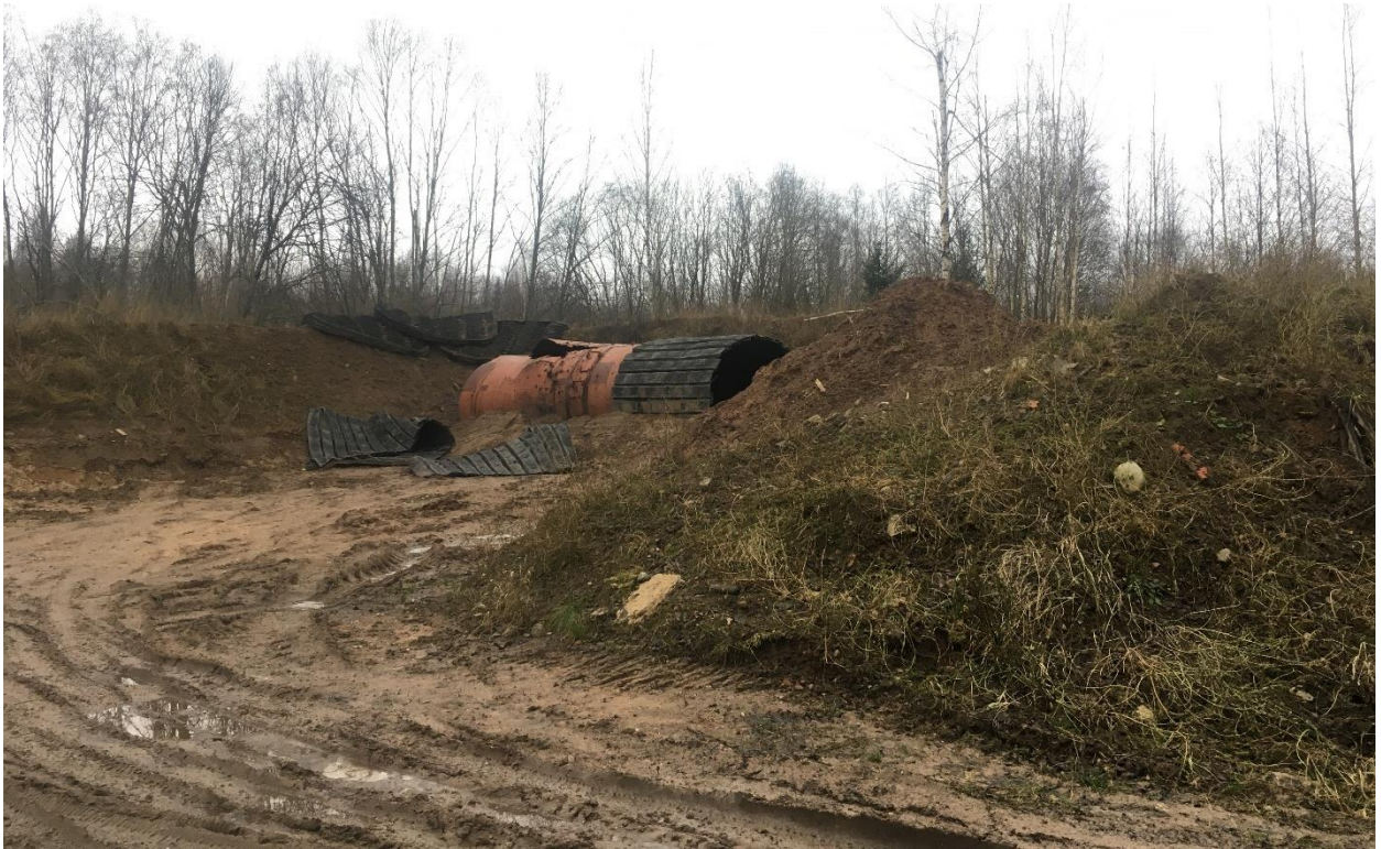
Foto 1. Päästeameti alaline lõhkamiskoht.

Alal on osaliselt säilinud sõjaväepolügooni rajatised (angaarid, kasarmute varemed, laskeavadega betoonist rajatised, laskeharjutusplatsid), millel kasutus puudub. Planeeringuala edelanurgas asub alaline lõhkamiskoht (foto 1), millele on seatud isiklik kasutusõigus Päästeameti kasuks.