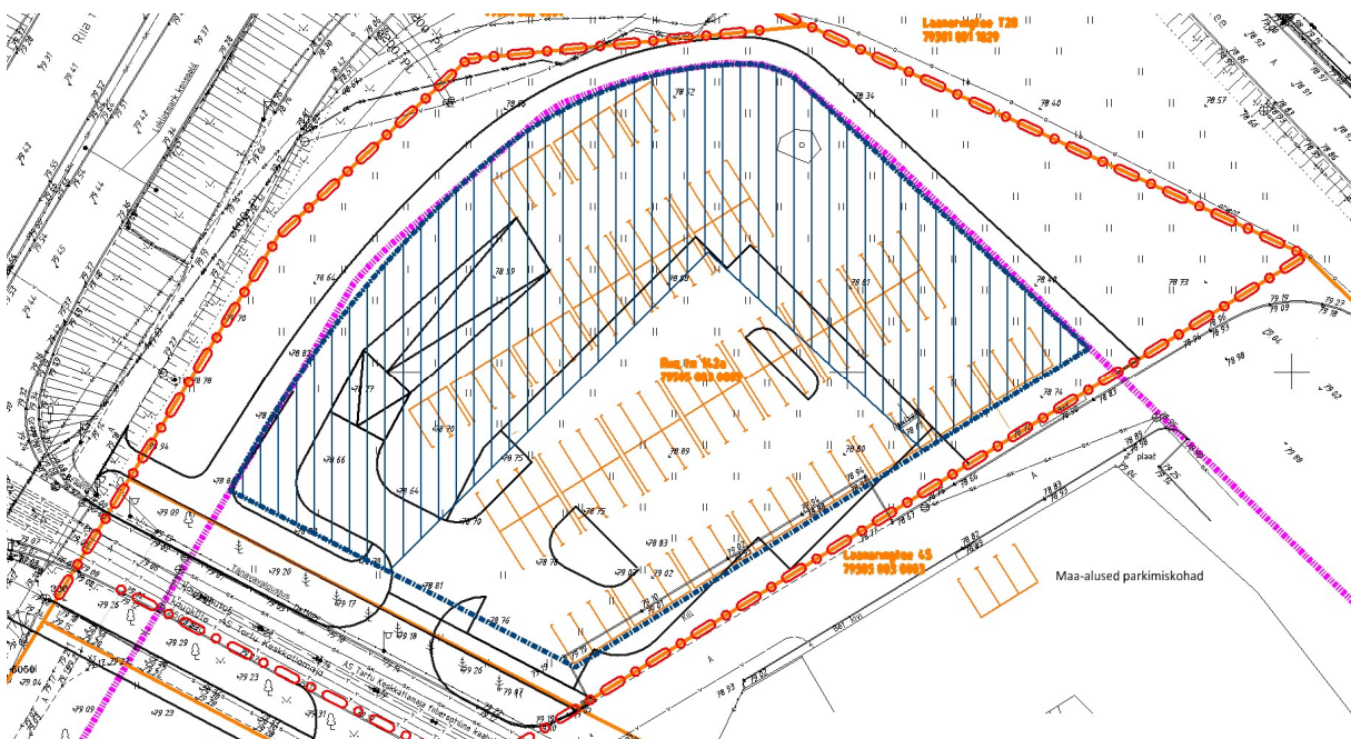
Skeem 1. Maa-aluse parkla orienteeriv parkimisskeem, parkimine võimalik lahendada kahel maa-alusel korrusel

Üks võimalik maa-aluse parkla lahendus on esitatud alloleval skeemil (skeem 1). Täpne parkimislahendus määratakse ehitusprojekti.