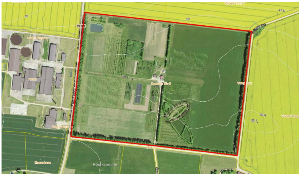
Skeem 2. Planeeritav maa-ala (aluskaart Maa-ameti ortofoto)

Õunaia tee 5 maaüksus on põhja- ja idaküljest ümbritsetud põllumaaga, lääneküljes asub Rõhu farmi hoonetekompleks ning lõunas haritav maa, talumaad ja elamud.