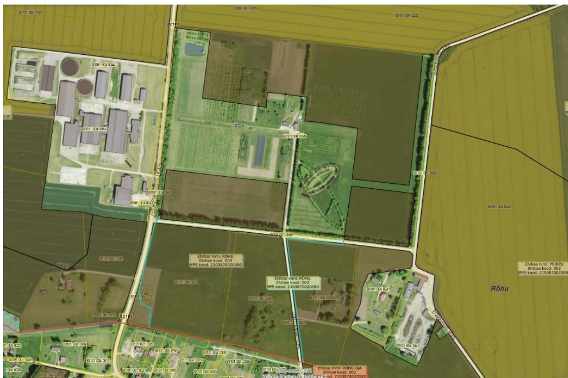
Skeem 5. Olemasolevad maaparandussüsteemid

Planeeritava krundi põhja-, kirde-, ida-, kagu- ja edelaosas paiknevad PRÜÜSI (ehitise kood 003, maaparandussüsteemikood 2103870020030) ja RÕHU (ehitise kood 003, maaparandussüsteemikood 2103870020090) maaparandussüsteemid.