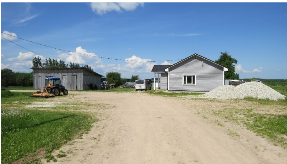
Foto 1. Garaaž-töökoda vasakul ja kontorihoone paremal

Olemasolevat olukorda kajastavad täpsemalt joonis 1 ja 3.