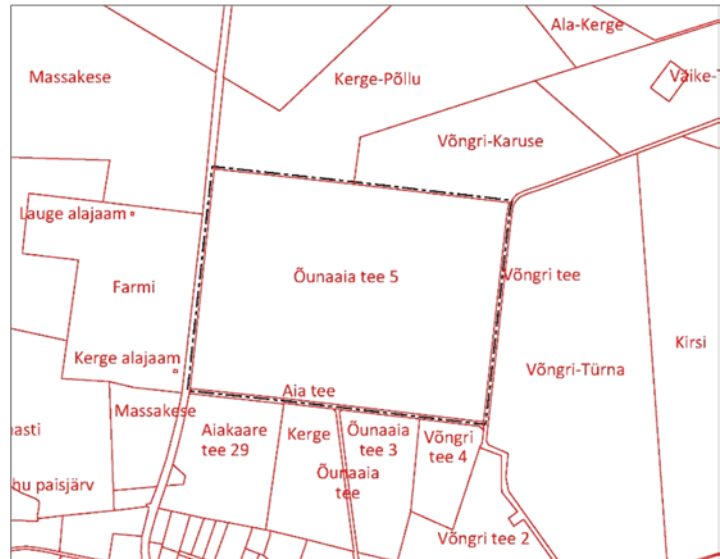
Skeem 3. Ümbrisevad krundid (piirid Maa-amet, 06.10.2021)