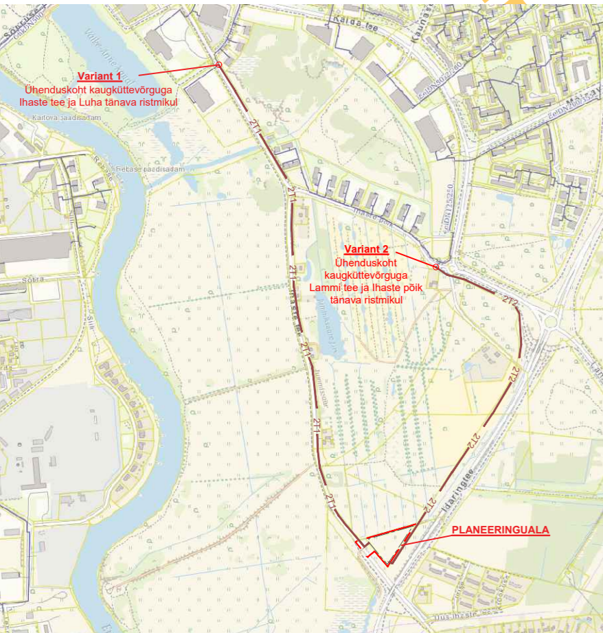
SKEEM 2. Planeeritud kaugkütte trasside põhimõtteline skeem väljaspool planeeringuala