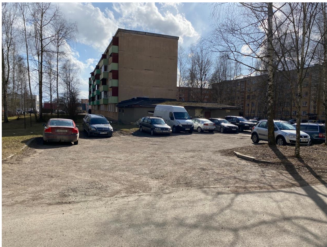
Foto 1. Vaade planeeringualale Lääne tänavalt.

Olemasolev olukord on graafiliselt nähtav joonisel nr 1 ja alloleval fotol 1.