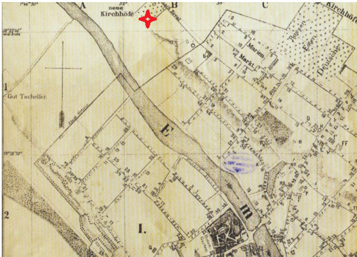
Skeem 4. Väljavõtte Laakmanni trükitud plaanist 1892 8 , mälestise asukoht tähistatud punase tähekesega.

Matmisala suurus oli 6 vakamaad, sellest kolm aiaga piiratud. Seda nimetati "uus saksa koguduse surnuaed". Suhteliselt hilise asutamisaja tõttu on Uue-Jaani kalmistule maetud vähem kultuuritegelasi kui Vana-Jaani kalmistule (asub Uus-Jaani kalmistust loodesuunas). Vana-Jaani kalmistu sai oma nime hulk aega hiljem, kui oli välja mõõdetud Uus-Jaani kalmistu.