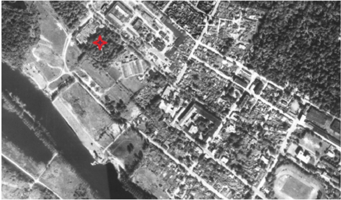
Skeem 5. Väljavõte 1995 ortofotost 11 , mälestise asukoht tähistatud punase tähekesega.