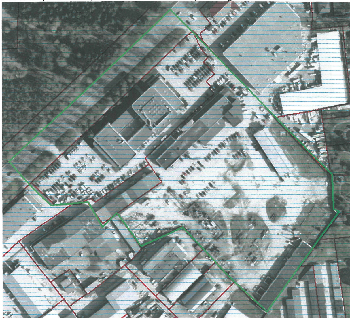
Riia tn 130, Riia tn 132 ja Riia tn 134 kruntide detailplaneeringuala situatsiooniskeem

Lisa Tartu Linnavolikogu 27. juuni 2013. a otsuse nr 495 juurde