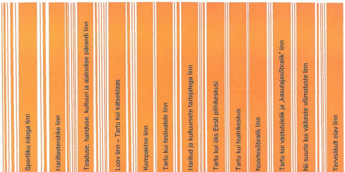
Joonis 1. Tartu eripärad

Iga linna areng saab tugineda tema tugevustele, väljakujunenud identiteedi põhijoontele. Milles väljendub Tartu eripära, tema „oma nägu”? Alljärgnevalt, tuginedes arengukava koostamise käigus toimunud arutelule, on esitatud kokkuvõtte Tartu eripäradest. Vaata joonis 1.