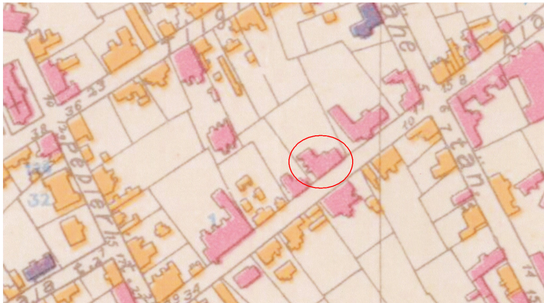
Väljavõte Tartu linna plaanist, 1920. a. EAA.2110.1.4822 leht 1