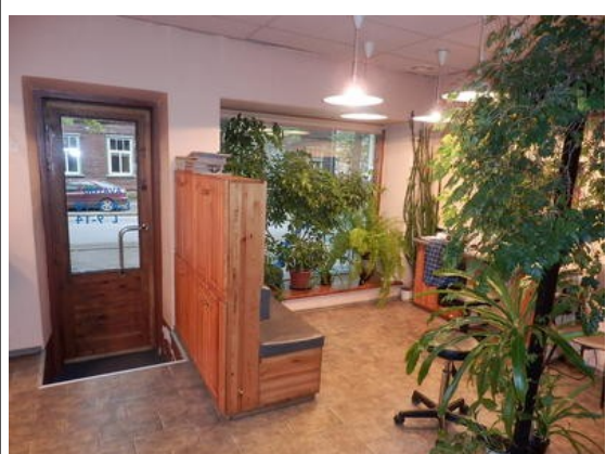
Naiste juuksuri pool