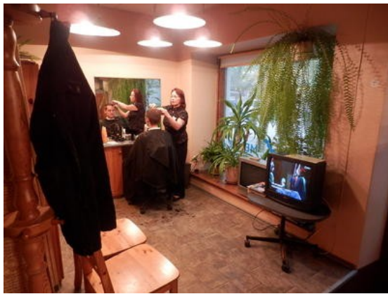
Meeste juuksuri pool