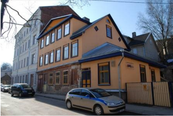
Foto 1. Renoveeritud Tähtvere 6 hoone ja tagapool arhitektuurimälestis Tähtvere 4