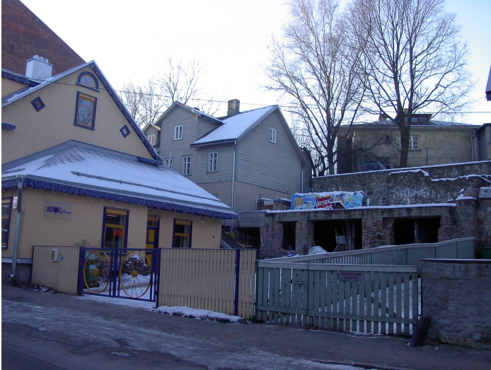
Foto 7. Vaade Tähtvere 6, 8 õuele ( säilinud hoone I korrus ja tulemüüri osad)

* Planeeringu põhikaart. Maakasutus (vt. Joonis 4)