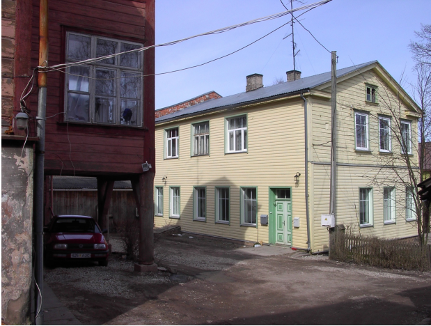
Foto 4. Ühe siseõue miljöö Tähtvere tänavalt

Peale nende majade asus krundil veel kivist pesukoda ja puidust kuurid. Tähtvere 10 elumaja ja kõrvalhooned säilinud ei ole. Tähtvere tänava maa-ala oli krundistatud ning ilmselt ka hoonestatud juba 18. saj keskpaigast. Kogu Tähtvere mõisa ümber tekkinud eeslinn liideti Tartu linnaga 1916. aastal ning tänav loeti kuuluvaks esimesse linnaossa