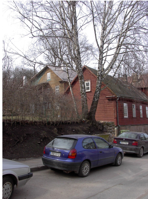
Foto 6. Vaade Tähtvere 14 krundile