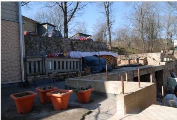
Foto 3. Vaade Tähtvere 8 säilinud hoone osale ülaõuest

Kõrghaljastus krundil puudub, kuid kõrvalkruntidel asuvad puud on haljaks raamistuseks. Madalad ilupõõsad on istutatud tänavaäärse Tähtvere 6 elamu õuepoolse fassaadi ette. Alumise õue osas on võimalik parkida kuni neli sõiduauto.