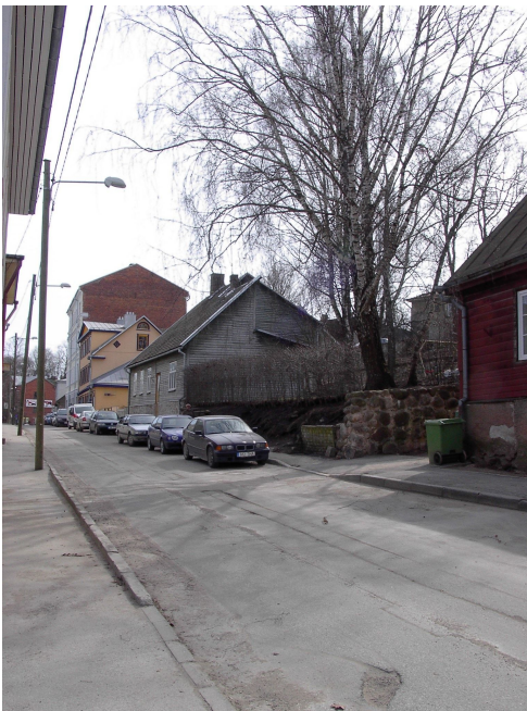
Foto 5. Tähtvere tänava miljöö

Kogu Supilinna miljööväärtusliku hoonestusala piires on säilinud valdavalt algupärane krundistruktuur ja Tähtvere tänava elamud asuvad enam-vähem ühel ehitusjoonel tänava ääres, kuid elumajad asuvad ka paljude kruntide õuealal moodustades nii justkui topelt hoonestuse rea. Korruselisus on 1–3. Piirkonnas on säilinud tänu omaaegsetele puit-ja segaehitusega hoonetele ja õdusatele siseõuedelega nn oma aja hõng.