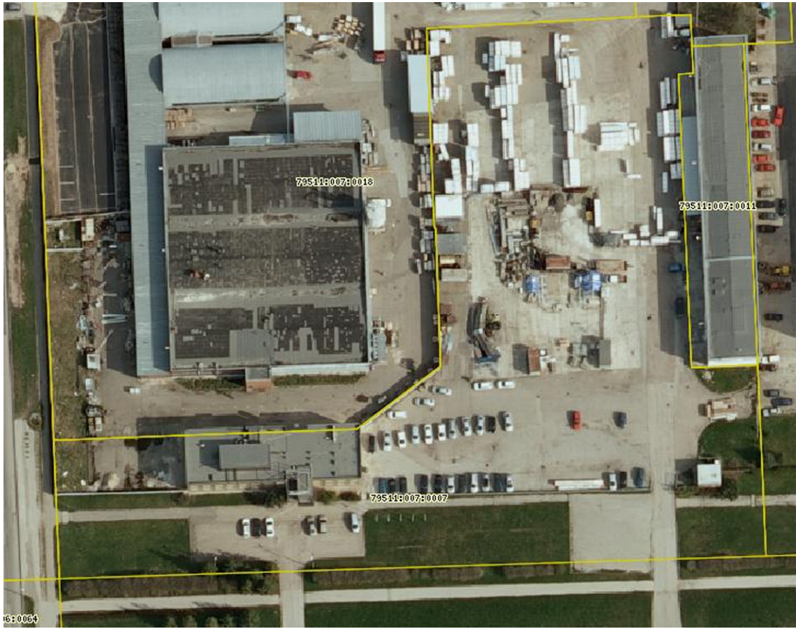
Skeem nr 1: olemasolev olukord Ringtee tn 12 krundil

Olemasolev maakasutus on esitatud tabelis 1.