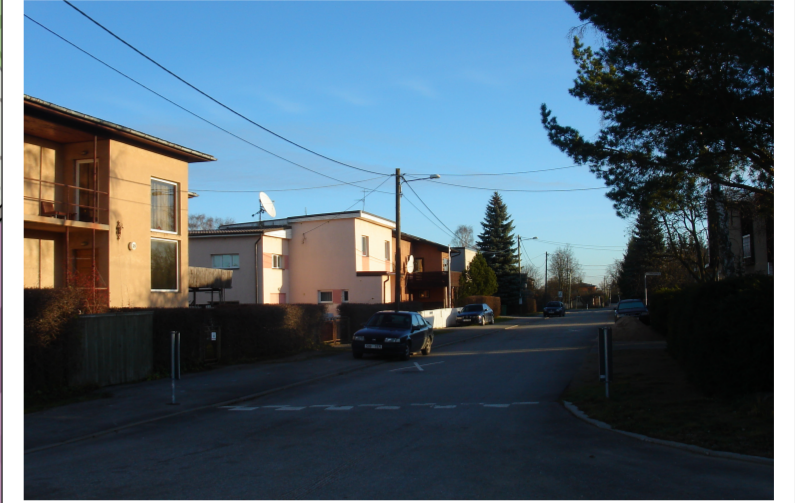
Korrapärase struktuuriga eramupiirkond - hooned joondatud tänavaga paralleelselt. Kõnniteed valdavalt ühel pool tänavat. Tiheduseindeks FAR = keskmiselt 0,3