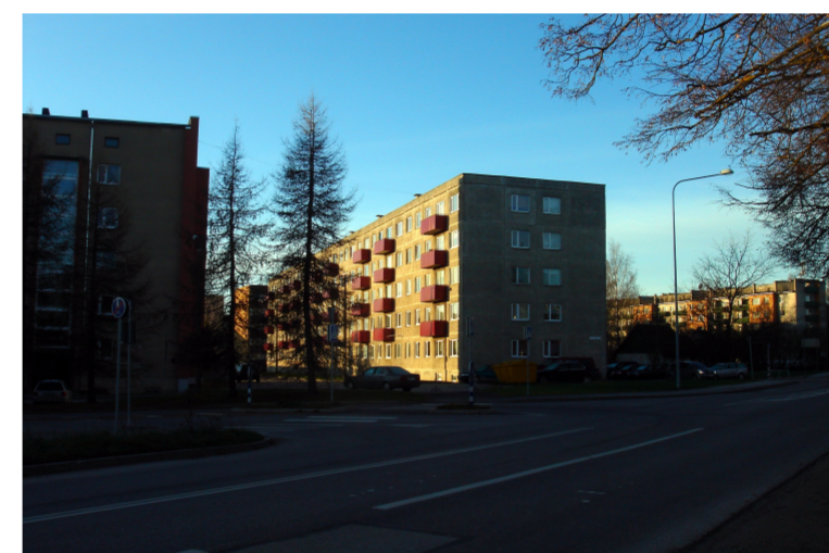
Vabaplaneeringuline korruselamute ala. Kõnniteed valdavalt ühel pool tänavat või puuduvad. Tiheduseindeks FAR = keskmiselt 1,2