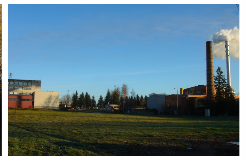
Korrapärase struktuurita tühermaa ja liiklusmaastikud. Kõnniteed puuduvad, toimivad sissetallatud jalgrajad.