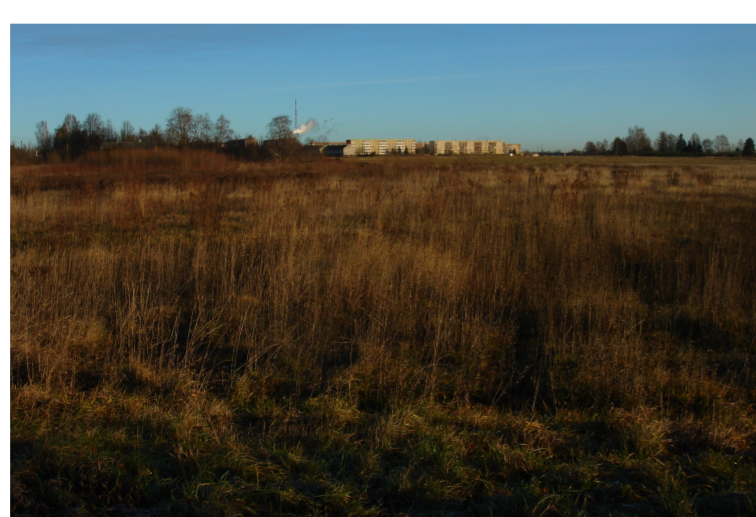
Ülenurme valla kavandatav maakasutus, valdavalt elamumaa. Elamumaal kavandatakse valdavalt eramute rajamist.