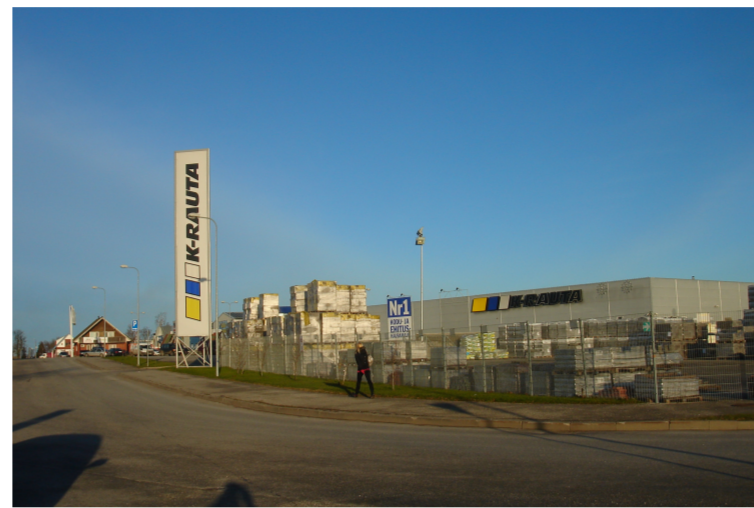
Logistika- ja kaubandusmaastik. Kõnniteed valdavalt ühel pool tänavat või puuduvad. Tiheduseindeks FAR jääb vahemikku 0,5 - 1