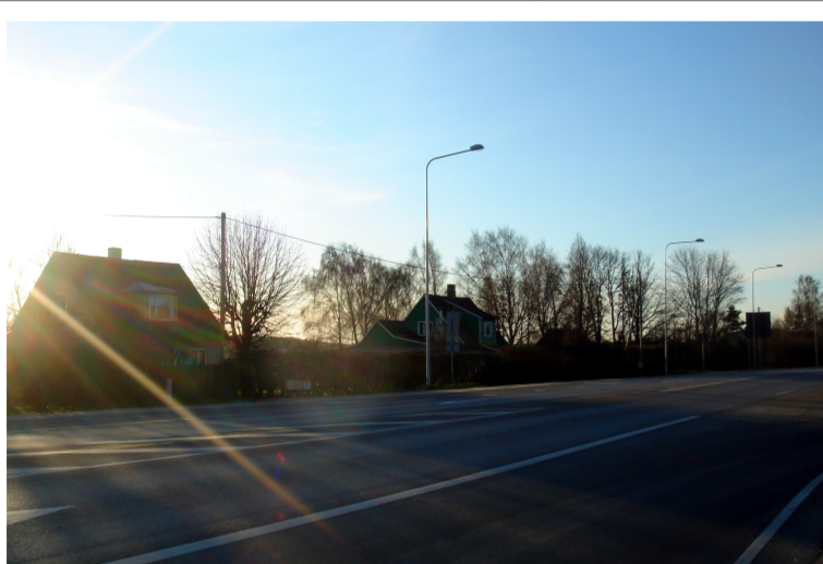
Eramustest moodustuv ridade struktuur. Kõnniteed puuduvad, olemas kergliiklustee ühel pool põhimaanteed. Tiheduseindeks FAR jääb alla 0,1