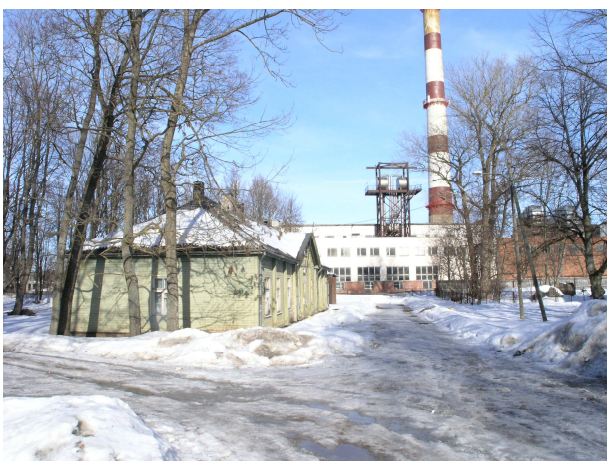
Pilt 6: Lina tn 8

Lina tn 8 on kompleksi vanim, 1830-ndatest pärinev puitkonstruktsioonis ühekorruseline klassitsistlikus stiilis hoone. Hoone algne maht on suuresti säilinud, kuid ruumijaotust on põhjalikult muudetud.