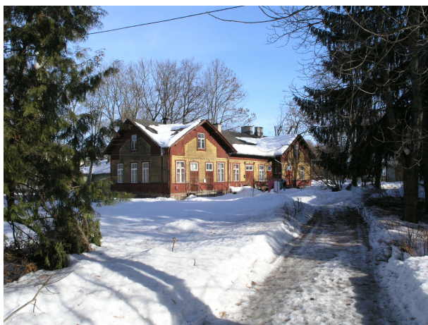
Pilt 5: Lina tn 4

Lina tn 8 on kompleksi vanim, 1830-ndatest pärinev puitkonstruktsioonis ühekorruseline klassitsistlikus stiilis hoone. Hoone algne maht on suuresti säilinud, kuid ruumijaotust on põhjalikult muudetud.