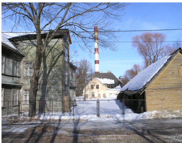
Pilt 2: paremal Lina tn 9, taga Lina tn 11, vasakul Lina tn 7

Lina tn 9 asub sisuliselt Lina tn 7 hoovis, ulatudes otsafassaadiga Aleksandri tänavale. Hoone on ühekorruseline valdavalt horisontaalpalkidest abihoone. Maja on ehitatud 1908. aastal.