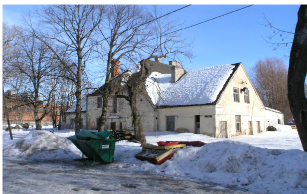
Pilt 3: Lina tn 11

tiibhoones oli katlamaja, mille tarvis oli rajatud kõrge telliskivikorsten. Aleksandri tänava pool asuvas tiibhoones paiknes desinfektsioonikamber. Teisele korrusele ehitati korterid.