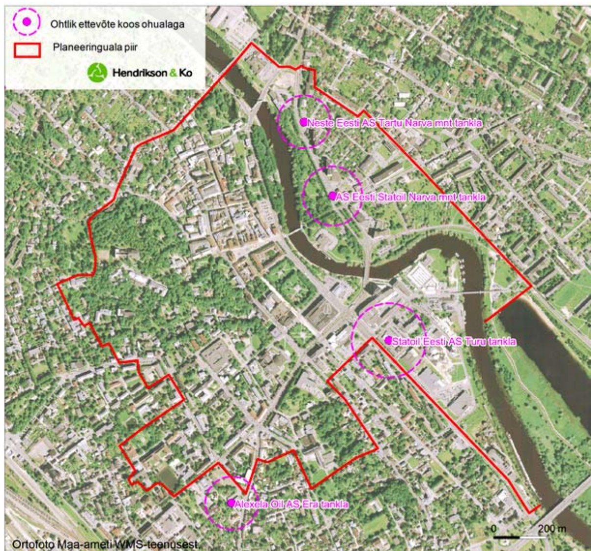
Joonis 2. Ohtlike ettevõtete paiknemine planeeringualal. Andmed: Maa-amet

Looduskeskkond. Hinnatakse planeeringuga kaasneva võivad mõjusid taimestikule, haljasaladele (sh Toomemäele) ja rohevõrgustikule; põhja- ja pinnaveele (Emajõgi, sh kallasraja ja ehituskeeluvööndiga seotud küsimused), ning kaitsealuste objektidele, sh kaitstavatele loomaliikidele (nahkhiired ja Emajões elavad liigid). Natura 2000 alasid planeeringualal või selle vahetus läheduses ei paikne ning mõju Natura 2000 aladele planeeringu elluviimisega ei kaasne.