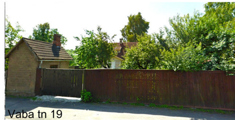
Vaba tn 19