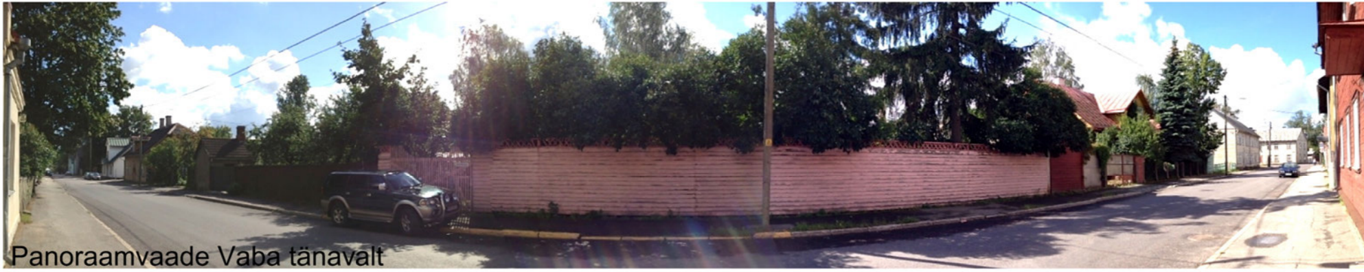
Panoraamvaade Vaba tänavalt