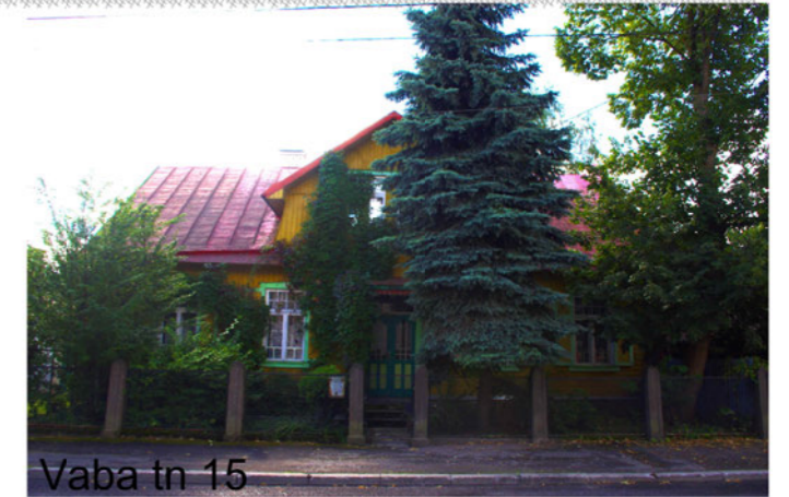
Vaba tn 15