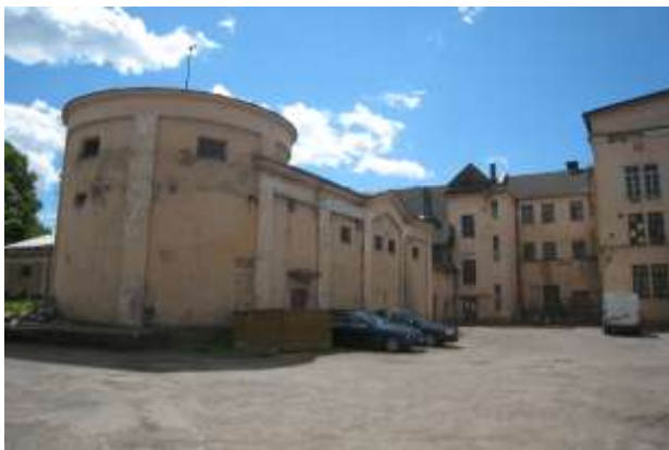
Foto 3. Endine piiritusekelder-ladu