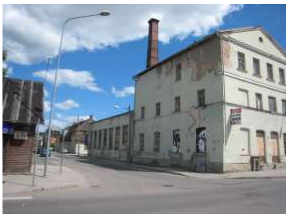
Foto 1. Pärnivabriku endine peahoone

Pika ja Pärna tänavate ristmikul Pikk tn 58 // Pärna tn 1 krundil asub endise pärmivabriku 1883. aastal ehitatud 3-korruseline peahoone (foto 1), millele on hiljem Pärna tänava poolsele küljele rajatud 1-korruseline juurdeehitis.