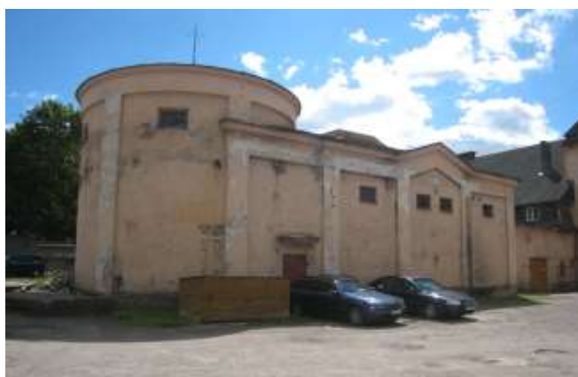
Foto 9. Säiliv toorainemahuti