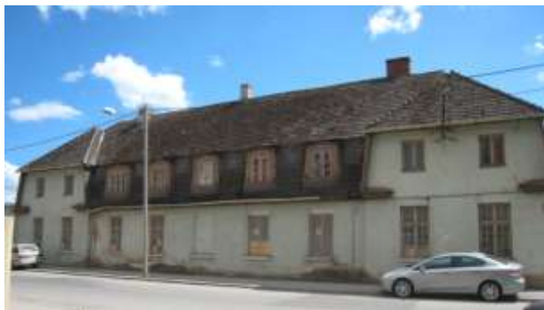
Foto 10. Säiliv Pärna tn äärne endine pärmivabriku kontorihoone