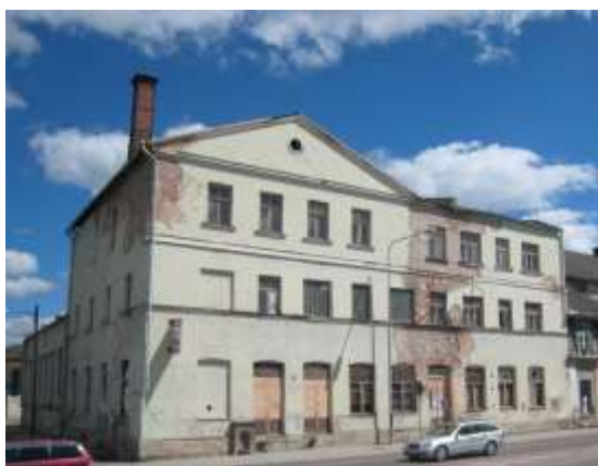
Foto 8. Säiliv endise pärmivabriku peahoone fassaad

Pika tänava äärses hooneosa esimese korruse tasandile ja endisesse toorainemahutisse (vt joonis 4) tuleb projekteerida avalikkusele suunatud äripinnad. Planeeringuga on pakutud lahendus 1195 m 2 avalikkusele suunatud äripinna ja kuni 11550 m 2 elamispinna kavandamiseks. Pindade suhet on lubatud projektiga täpsustada tingimusel, et parkimise ja haljastuse nõuded on tagatud.