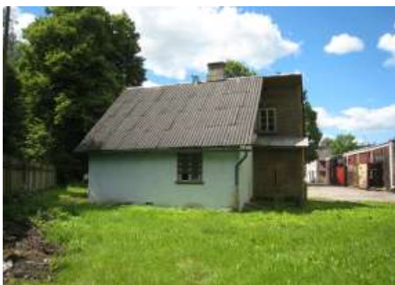
Foto 7. Uus tn 37 elamu