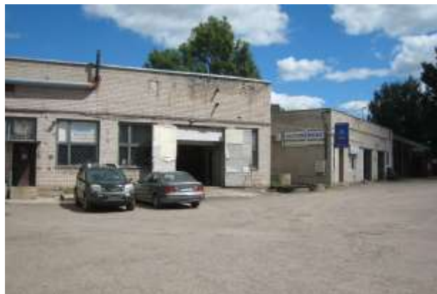
Foto 4. Kirdepiiril paiknevad garaažid

Pika tänava ääres Pikk tn 60 // 64 krundil paikneb kolmekorruseline endine haigla hoone (foto 2), mille ühes osas tegutses apteek. Kergliiklustee ääres asub 1- ja 2-korruseline hoone, kus tegutses loomakliinik (foto 5). Krundi sügavuses asuvad 1-korruselised garaaž ning ärihoone. Uus tn 37 krundil paikneb kahekorruseline tühjalt seisev elamu (foto 7).