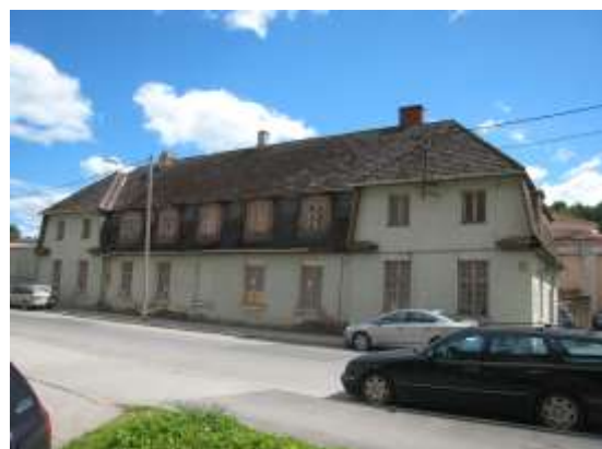
Foto 6. Endine pärmivabriku kontorihoone