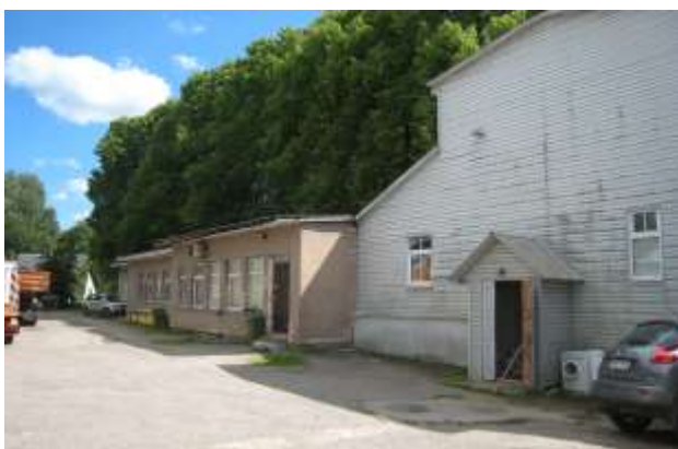
Foto 5. Lõunapiiril paiknev hoonestus

Pika tänava ääres Pikk tn 60 // 64 krundil paikneb kolmekorruseline endine haigla hoone (foto 2), mille ühes osas tegutses apteek. Kergliiklustee ääres asub 1- ja 2-korruseline hoone, kus tegutses loomakliinik (foto 5). Krundi sügavuses asuvad 1-korruselised garaaž ning ärihoone. Uus tn 37 krundil paikneb kahekorruseline tühjalt seisev elamu (foto 7).