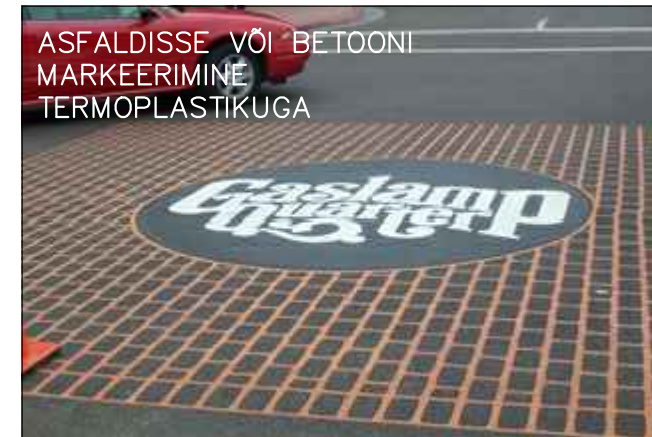
BETONKIVISSE MARKEERIMINE VALATUD BETOONIGA