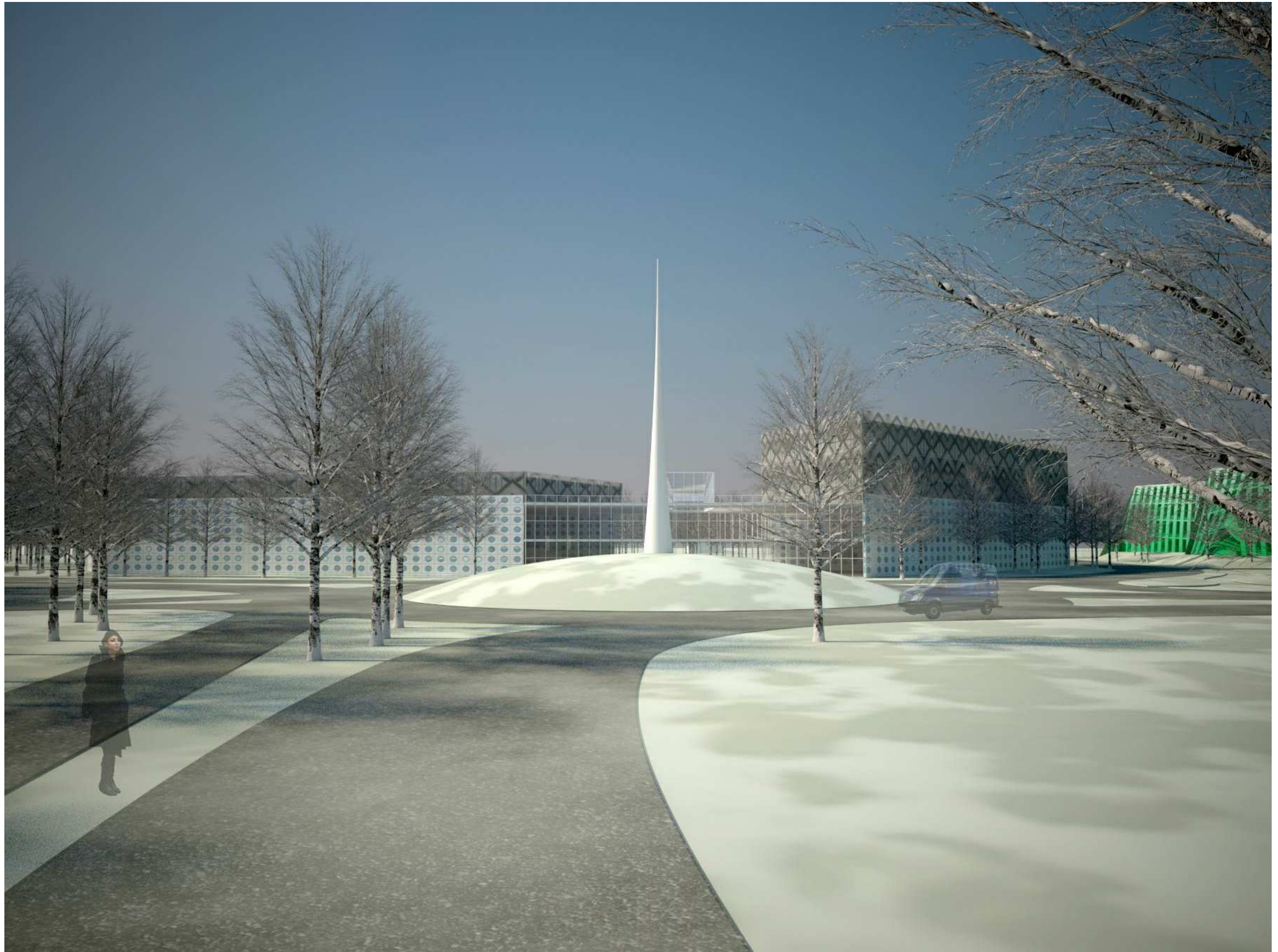
TARTU, RIIA TN. 193 KRUNDI MAHULINE ANALÜÜS DETAILPLANEERINGU ALGATAMISEKS - PERSPEKTIIVVAADE - ARHITEKT ARMIN VALTER