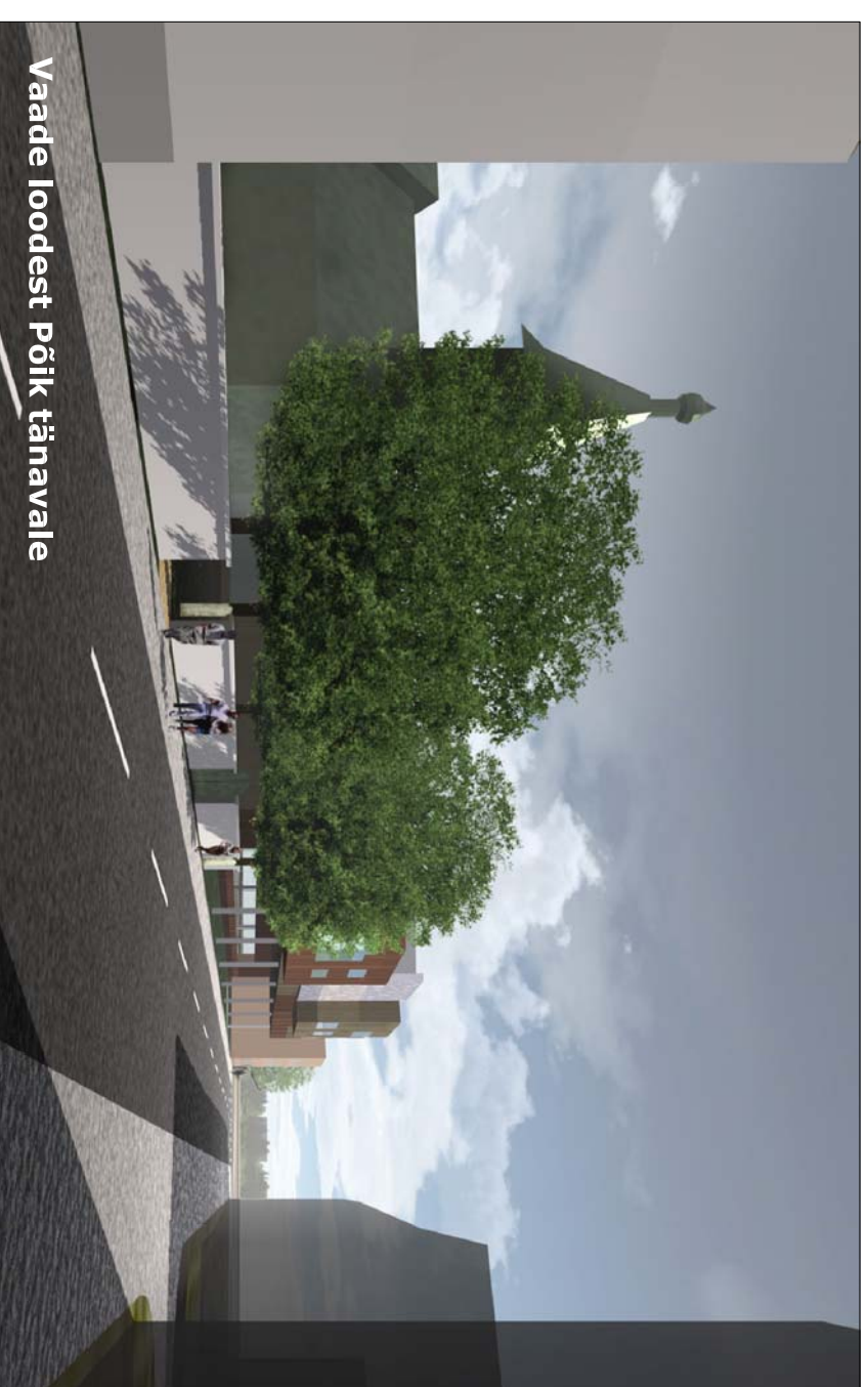
Vaade loodest Põik tänavale