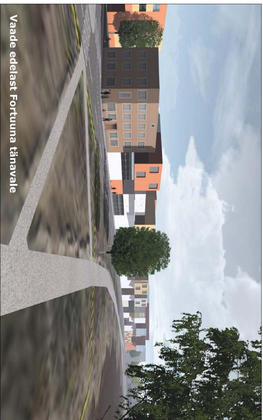
Vaade edelast Fortuuna tänavale