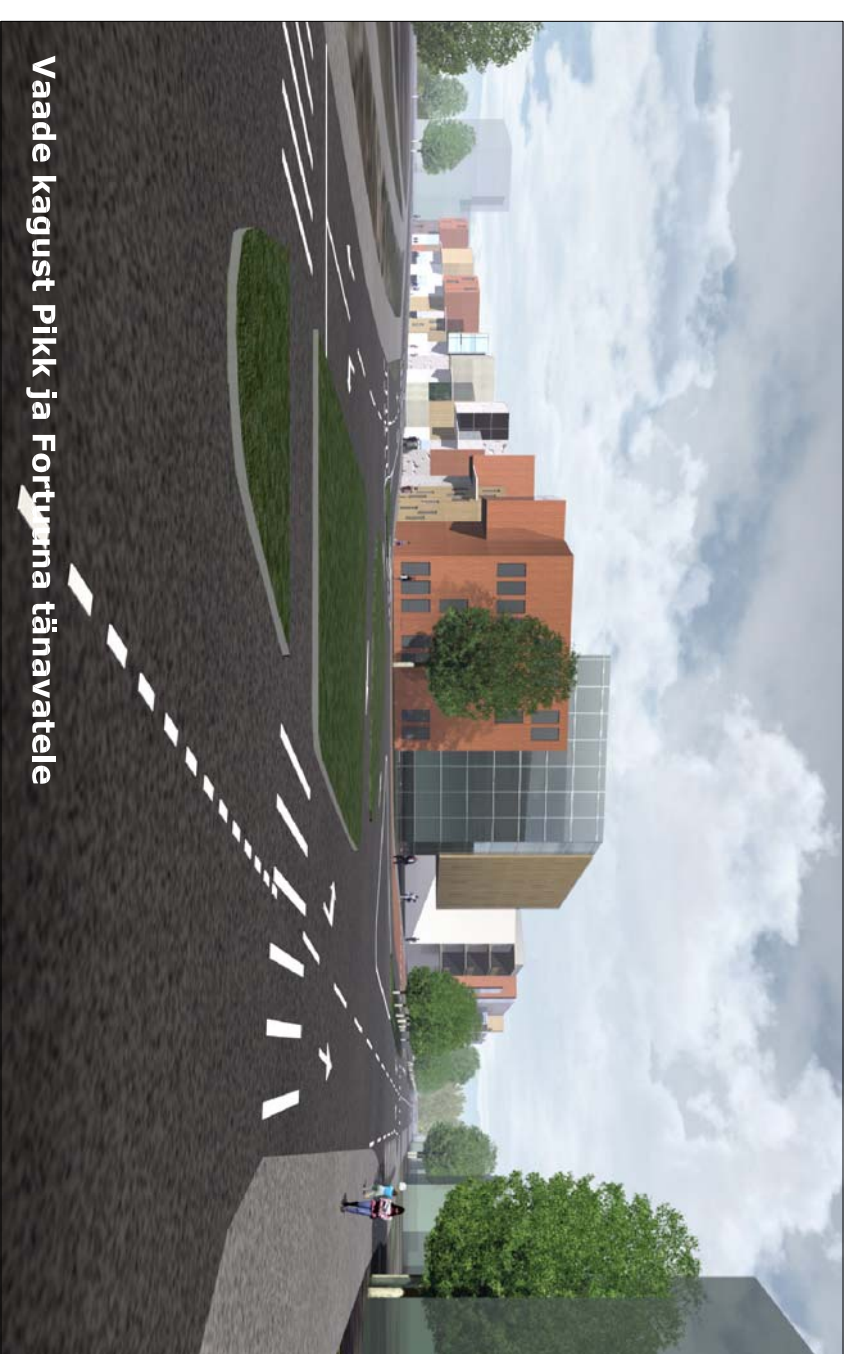
Vaade kagust Pikk ja Fortuuna tänavatele