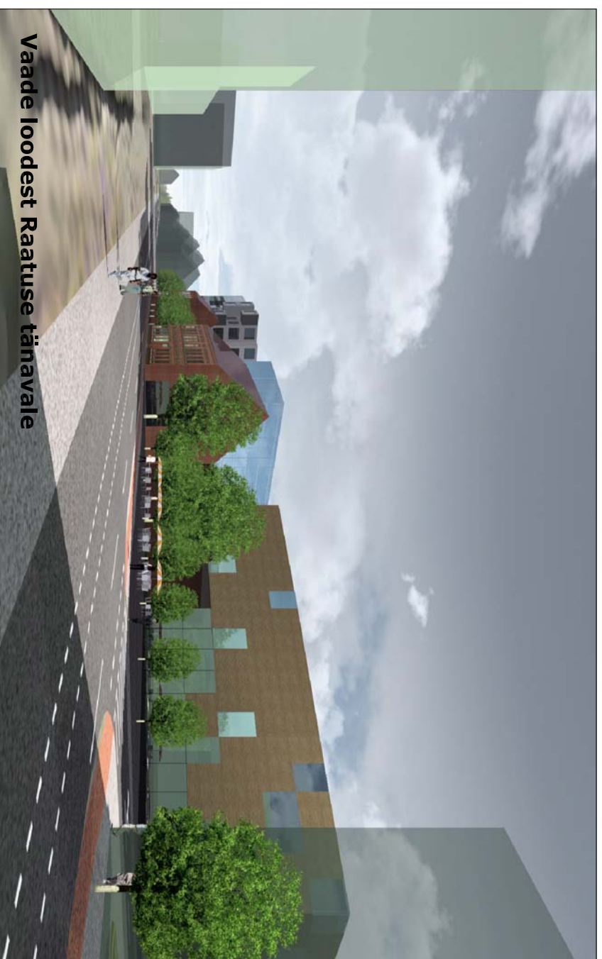
Vaade loodest Raatuse tänavale