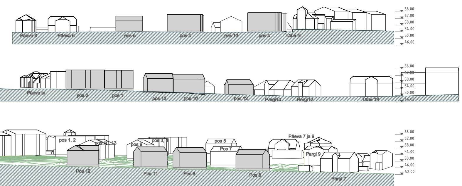
Päeva Tähe ja Pargi tänavate laotised koos kavandatud hoonemahtudega Planeeringu eskiisi illustreeriv mudel