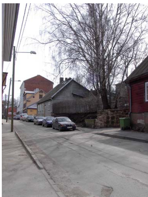
Foto 5- Tähtvere tänava miljöö

Kogu Supilinna miljööväärtusliku hoonestusala piires on säilinud valdavalt algupärane krundistruktuur ja Tähtvere tänava elumud asuvad enam-vähem ühel ehitusjoonel tänava ääres, kuid elumajad asuvad ka paljude kruntide õuealal moodustades nii justkui topelt hoonestuse rea. Korruselisus on 1-3. Piirkonnas on säilinud tänu omaaegsetele puit-ja segaehitusega hoonetele ja õdusatele siseõuedeale nn oma aja hõng.