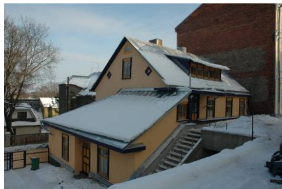
Foto 1- Renoveeritud Tähtvere 6 hoone ja tagapool Foto 2- Vaade Tähtvere 8 hoone osalt Tähtvere 6-le arhitektuurimälestis Tähtvere 4

Kinnistul asub renoveeritud Tähtvere 6 elamu, segaehitis, millel on kolm korrust (osa hoonest on ühekorruseline ja kolmas korrus on osaliselt katusealune korrus). Esimesel korrusel asuvad OÜ Autoreklaam büroo/tööruumid ja kahel ülemisel korrusel on korterid. Alumine hoone osa on kivist ja selle õuepoolne osa ulatub keldrina mäe külje sisse ning selle osa peal on ülemine õue osa, mida kasutatakse lisajuurdepääsuks teisele ja kolmandale korrusele aga ka ühtlasi Jakobi 31 elamu ühele küljele. Sellele õuetasandile on autoga juurdepääs võimalik Jakobi tänavalt läbi Tähtvere 4 kinnistu. Erinevad õuetasandid on omavahel trepiga ühendatud. Tähtvere tänava poolt on krunt piiratud metallpostide ja – raamistikuga puitlippaiaaga, milles on metallkaunistustega sõiduvärv, Tähtvere 12 kinnistu piiril on puitlippaied ja ülemine õue osa on Jakobi 31 hoone kõrval piiratud metallvõrkaia osaga, juurdepääs Tähtvere 4 krundi poolt aga betoonist lillekastidega.