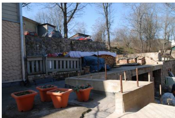
Foto 3- Vaade Tähtvere 8 säilinud hoone osale ülaõuest

Kõrghaljastus krundil puudub, kuid kõrvalkrundidel asuvad puud on haljaks raamistuseks. Madalad ilupõõsad on istutatud tänavaäärse Tähtvere 6 elamu õuepoolse fassaadi ette. Alumise õue osas on võimalik parkida kuni neli sõiduautot.