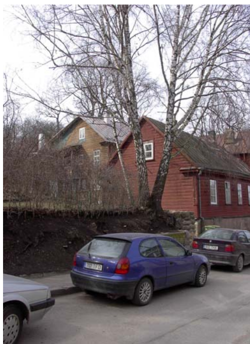
Foto 6- Vaade Tähtvere 14 krundile