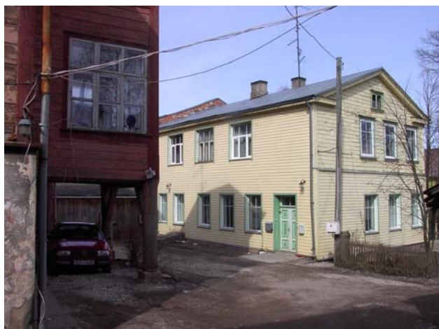
Foto 4 - Ühe siseõue miljöö Tähtvere tänavalt

Peale nende majade asus krundil veel kivist pesukoda ja puust kuurid. Tähtvere 10 elumaja ja kõrvalhooned säilinud ei ole. Tähtvere tänava maa-ala oli krundistatud ning ilmselt ka hoonestatud juba 18. saj keskpaigast. Kogu Tähtvere mõisa ümber tekkinud eeslinn liideti Tartu linnaga 1916. aastal ning tänav loeti kuuluvaks esimesse linnaossa