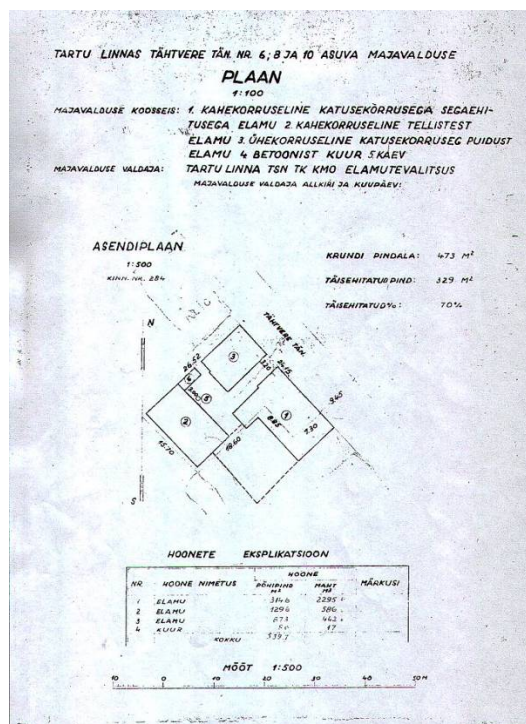
Skeem 2- Krundi plaan 1963.a