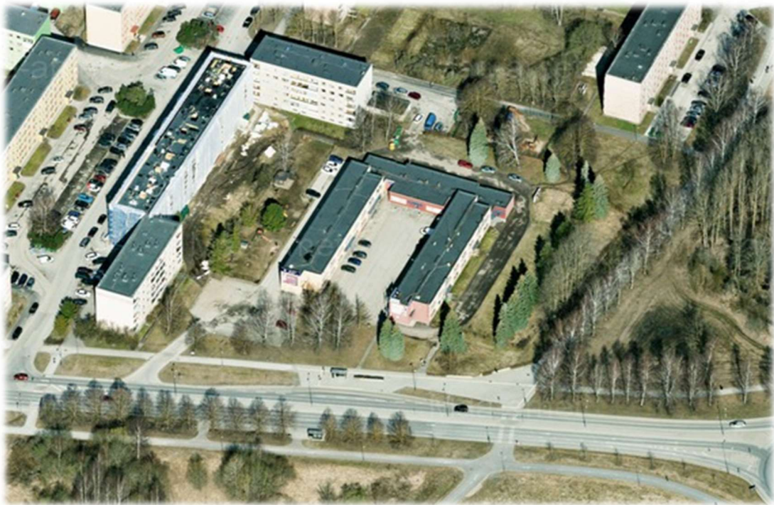
Maa-ameti kaldaerofoto 13.04.2022