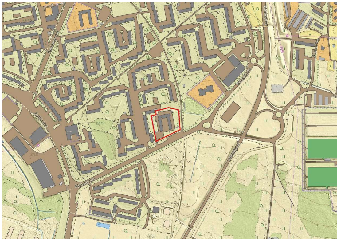
Skeem 1. Mõisavahe tn 21 krundi asukoha skeem (alus: Maa-ameti Eesti põhikaart).

Käesolev dendroloogiline hinnang on koostatud ASPIN-TARTU OÜ tellimusel Mõisavahe tn 21 krundi detailplaneeringu alusmaterjaliks. Dendroloogilise hindamise välitööd teostati juulis 2022. a Karl Hanssoni poolt.