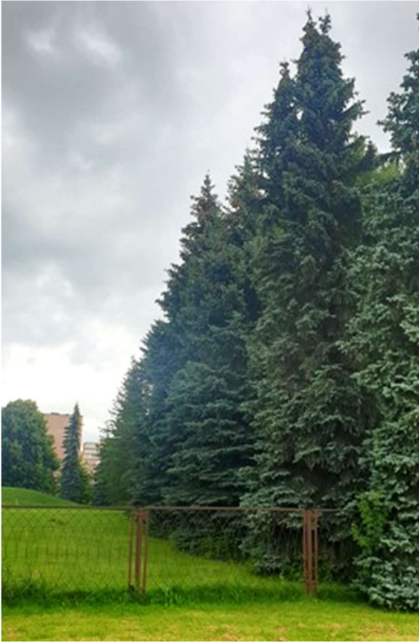
Foto 3. Torkavate kuuskede rida krundi idaosas