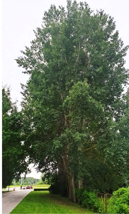
Foto 4. Haabade rida krundi idapiiril