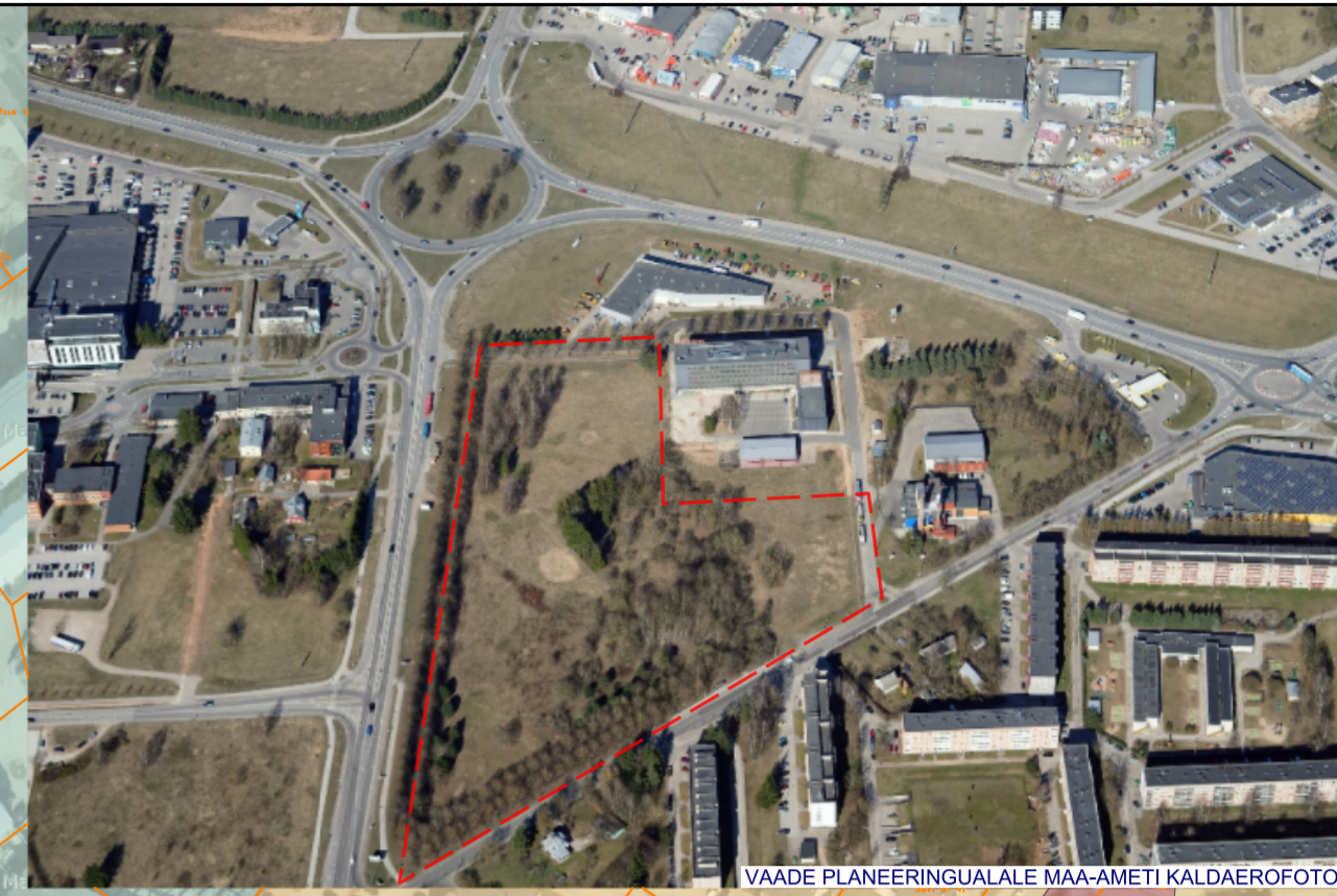
VAADE PLANEERINGUALALE MAA-AMETI KALDAEROFOTOLO

KAUBANDUSKESKUS 'LÖUNAKESKUS' 1...3 K HOTELL 7 K