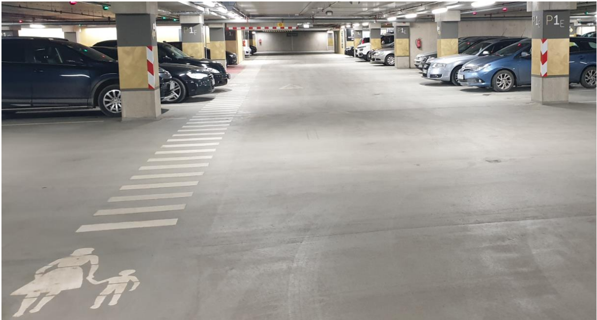
Pilt 1. Näide parklasisese jalgteel markeerimisest

Planeeritud Pos 1 krundil on olemasolev jalakäijate ja jalgratturite juurdepääs lääne suunast olemasolevalt jalgratta- ja jalgteelt, lubatud on täiendavate jalakäijate ja jalgratturite juurdepääsude rajamine. Sõidukite juurdepääsu Pos 1 krundile planeeritud ei ole, teenindava transpordi juurdepääs on vajadusel võimalik jalgratta- ja jalgteel kaudu. Pos 2 on planeeritud jalakäijate ja jalgratturite juurdepääsud põhja suunast ja lääne suunast olemasolevatelt jalgratta- ja jalgteedelt. Jalg- ja/või jalgrattateede ristumine sõiduteedega tuleb teha jalg- ja/või jalgrattateel tasapinnas (tagades reljeefse kiviga ka nägemispuudega inimesele sõnumi teist liiki liiklusega ristumisest), sõiduteest eristuva katendiga, et potentsiaalne suurem ohuala eristuks muust teest. Jalgratta- ja/või jalgteedel peab olema tagatud standardi kohane külgohtusala. Hoonete kavandamisel tuleb pöörata tähelepanu jalakäijate liikumise turvalisusele ja mugavusele. Hoone(te) projekti koosseisus peab olema joonis, mis kajastab jalakäijate põhisuundade kavandamist. Parklasiseselt tuleb kas markeerida või teha sõiduteest eristuvast materjalist vähemalt 1,5 m laiune ja parkimiskohtadest vähemalt 0,5 m kaugusel olev jalakäiguala parkimiskohtadest hoone sissepääsuni.