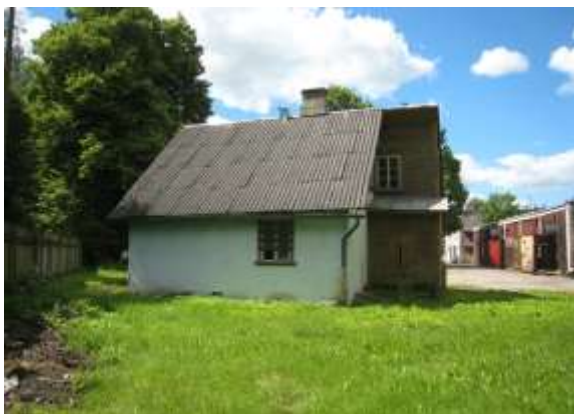
Foto 7. Uus tn 37 elamu