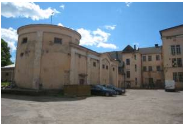
Foto 3. Endine piiritusekelder-ladu