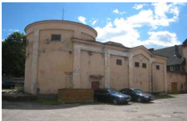
Foto 9. Säiliv toorainemahuti