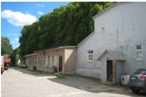
Foto 5. Lõunapiiril paiknev hoonestus

Pika tänava ääres Pikk tn 60 // 64 krundil paikneb kolmekorruseline endine haigla hoone (foto 2), mille ühes osas tegutses apteek. Kergliiklustee ääres asub 1- ja 2-korruseline hoone, kus tegutses loomakliinik (foto 5). Krundi sügavuses asuvad 1-korruselised garaaž ning ärihoone. Uus tn 37 krundil paikneb kahekorruseline tühjalt seisev elamu (foto 7).