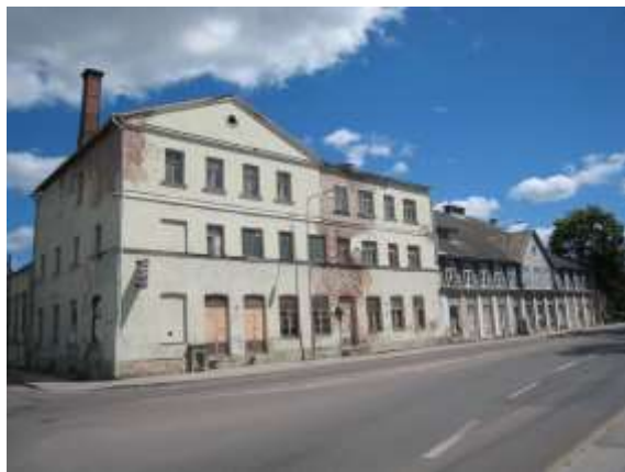
Foto 2. Vaade Pikalt tänavalt

Hoovis asub 1927. aastal ehitatud piiritusekelder-ladu (foto 3), mille ümar juurdeehitis pärineb 1935. aastast. Pärna tänava ääres asub kahekorruseline pärmivabriku kontorihoone (foto 6). Teised vabrikut teenindavad hooned on käesolevaks ajaks lammutatud. Planeeringuala kirdepoolsele piirile on hilisemalt ehitatud ühekorruseline garaaž ja sõidukite teenindushoone (foto 4). Krundi sügavuses asub ühekorruseline kasutuseta töökoja hoone.