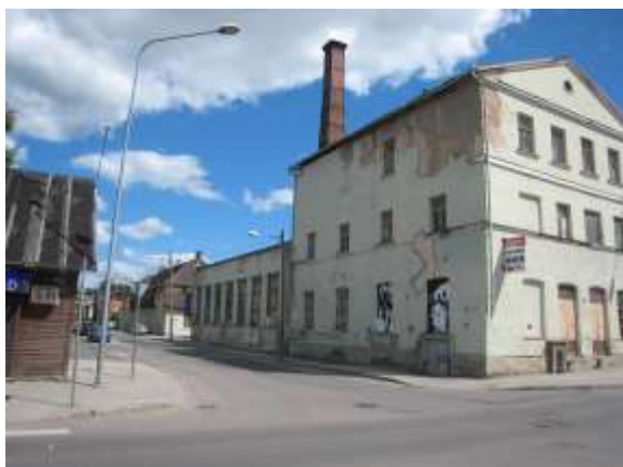
Foto 1. Pärmivabriku endine peahoone

Pika ja Pärna tänavate ristmikul Pikk tn 58 // Pärna tn 1 krundil asub endise pärmivabriku 1883. aastal ehitatud 3-korruseline peahoone (foto 1), millele on hiljem Pärna tänava poolsele küljele rajatud 1-korruseline juurdeehitis.