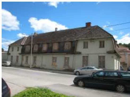
Foto 6. Endine pärmivabriku kontorihoone