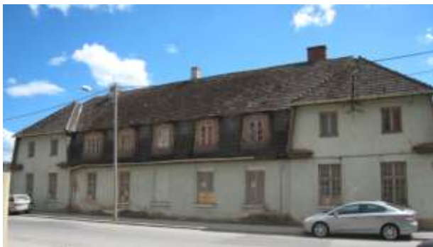
Foto 10. Säiliv Pärna tn äärne endine pärmivabriku kontorihoone