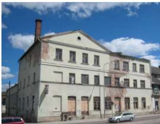
Foto 8. Säiliv endise pärmivabriku peahoone fassaad

Pika tänava äärse hooneosa esimese korruse tasandile ja endisesse toorainemahutisse (vt joonis 4) tuleb projekteerida avalikkusele suunatud äripinnad. Planeeringuga on pakutud lahendus 1195 m 2 avalikkusele suunatud äripinna ja kuni 11550 m 2 elamispinna kavandamiseks. Pindade suhet on lubatud projektiga täpsustada tingimusel, et parkimise ja haljastuse nõuded on tagatud.