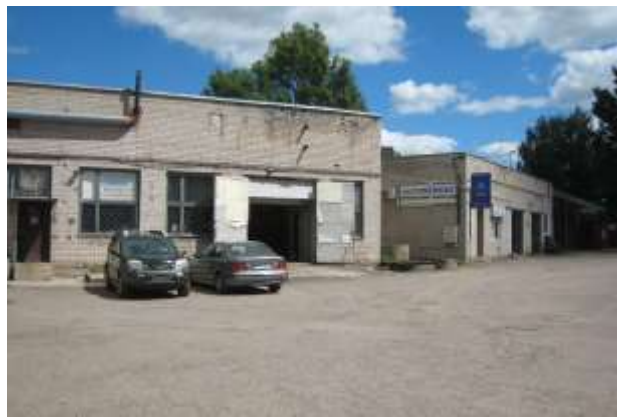
Foto 4. Kirdepiiril paiknevad garaažid

Pika tänava ääres Pikk tn 60 // 64 krundil paikneb kolmekorruseline endine haigla hoone (foto 2), mille ühes osas tegutses apteek. Kergliiklustee ääres asub 1- ja 2-korruseline hoone, kus tegutses loomakliinik (foto 5). Krundi sügavuses asuvad 1-korruselised garaaž ning ärihoone. Uus tn 37 krundil paikneb kahekorruseline tühjalt seisev elamu (foto 7).