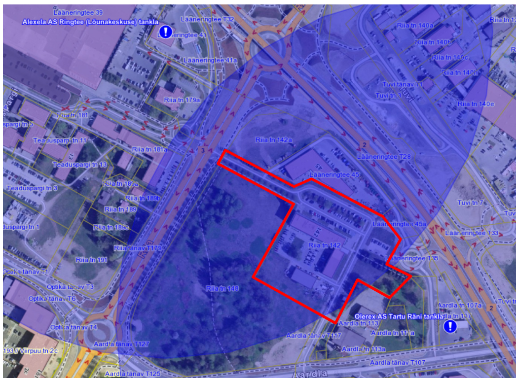
Skeem 2. Väljavõtte Maa-ameti ohtlike ettevõtete kaardirakendusest. Punasega tähistatud planeeringuala, sinisega ohtlike ettevõtete (tanklad) ohualad.

Ohtliku käitise ohuala on ala, mille piires tekib käitises toimunud õnnetuse korral oht inimese elule, tervisele ja varale. Mõlema käitise ohtlikkuse klass on C ning ohtudeks on soojuskiirgus ja ülerõhk.