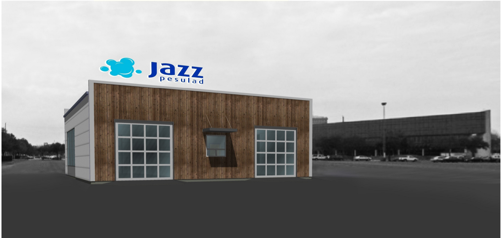
Variant 1. illustreeriv joonis*