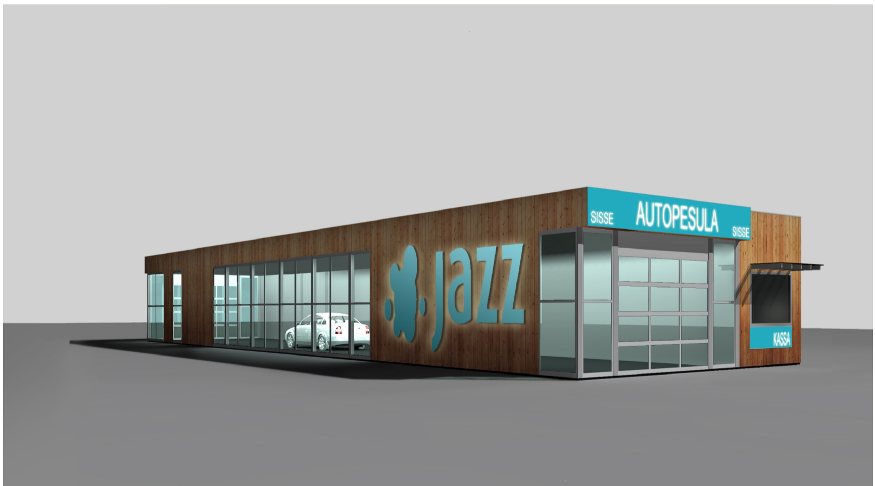
Variant 2. illustreeriv joonis*

* - illustreerivad joonised tellija poolt