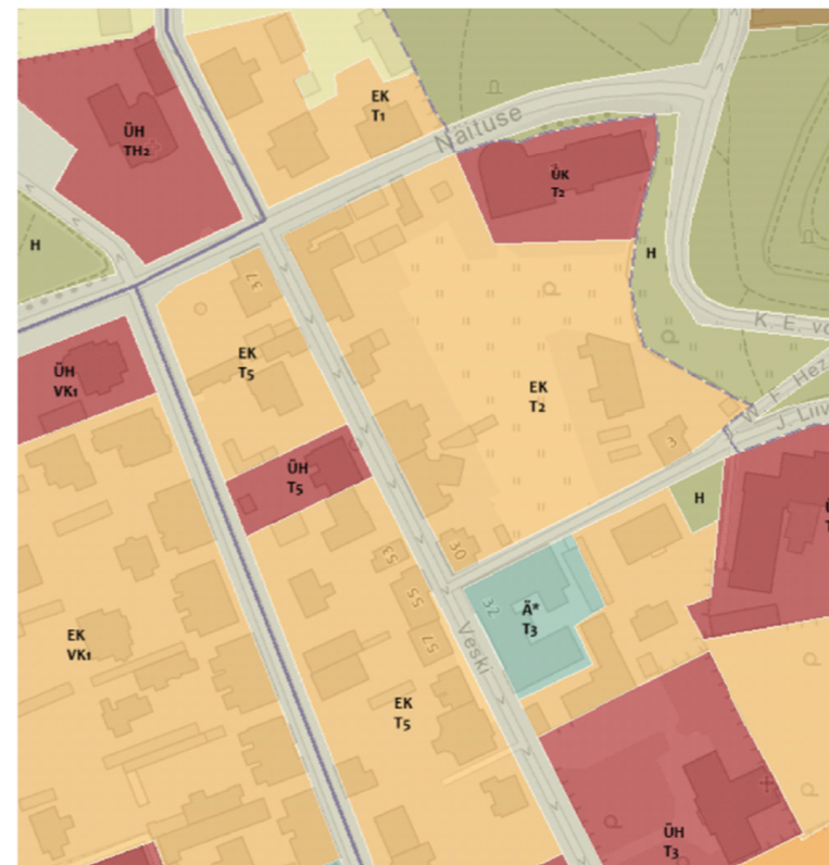
Väljavõte Tartu linna üldplaneeringust