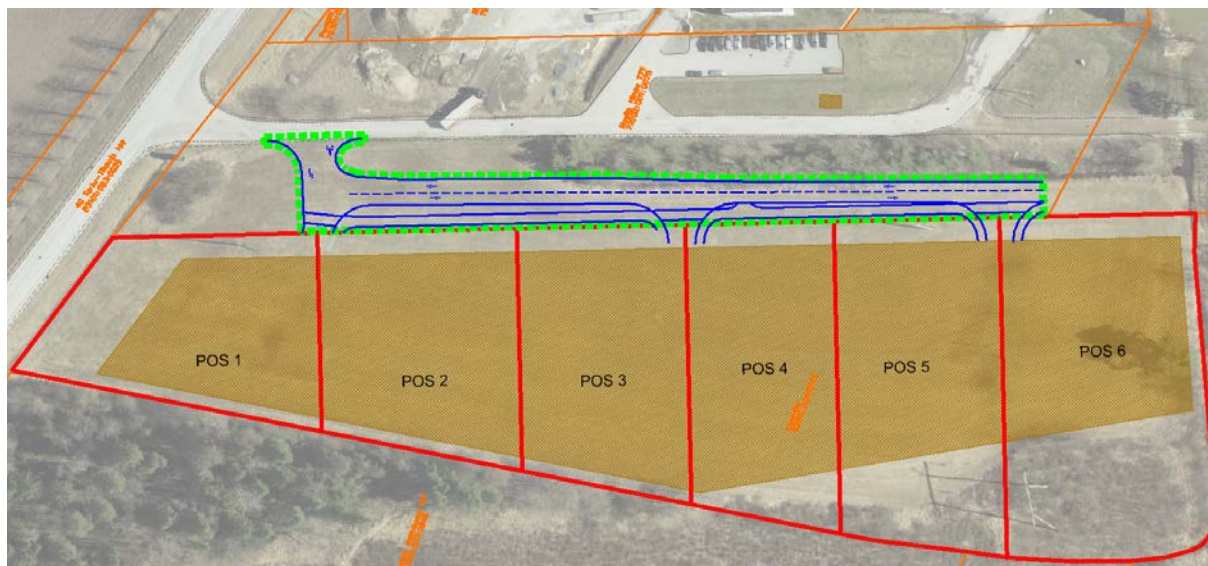
Skeem 1. Uuetalu maaüksuse igakordse omaniku tänavamaa väljaehitamise kohustuse ala, tähistatud rohelise punktiirjoonega – vajalik on välja ehitada kaheajaline sõidutee tulevase Ravila tänava läänepoolsete sõiduradade asukohas ja kõnnitee kavandatud kruntide poolsel küljel.

Krundi igakordne omanik koostab ehitusprojekti ja ehitab välja ehitusõiguse realiseerimiseks vajalikud planeeringukohaselt projekteeritud rajatised. Planeeringuga kavandatud mistahes hoonele ehitusloa andmise eelduseks on planeeringuga sätestatud tingimuste täitmine. Juhul kui nimetatud tingimusi ei ole täidetud, on Tartu linnal õigus keelduda mistahes planeeringukohase hoone ehitusloa andmisest või tunnistada detailplaneering kehtetuks. Ehitusloa võib anda enne eelnimetatud tingimuste täitmist, kui krundi igakordne omanik on sõlminud enne mistahes esimesele hoonele ehitusloa andmist Tartu linnaga lepingu, millega antakse rajatiste väljaehitamise kohustuse täitmiseks hiljemalt planeeritud esimese hoone valmimise ajaks piisavad tagatised. Hoone loetakse valminuks, kui sellele on väljastatud kasutusluba.