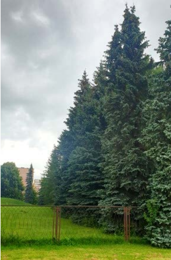
Foto 3. Torkavate kuuskede rida krundi idaosas