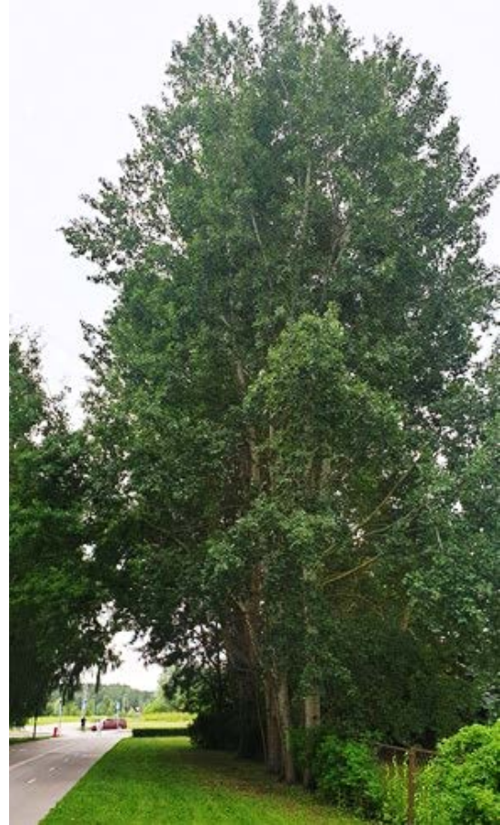
Foto 4. Haabade rida krundi idapiiril