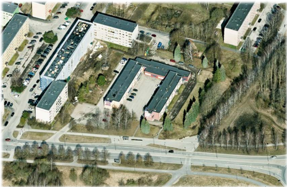
Maa-ameti kaldaerofoto 13.04.2022