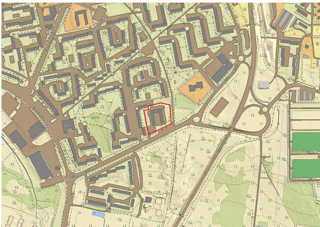
Skeem 1. Mõisavahe tn 21 krundi asukoha skeem (alus: Maa-ameti Eesti põhikaart).