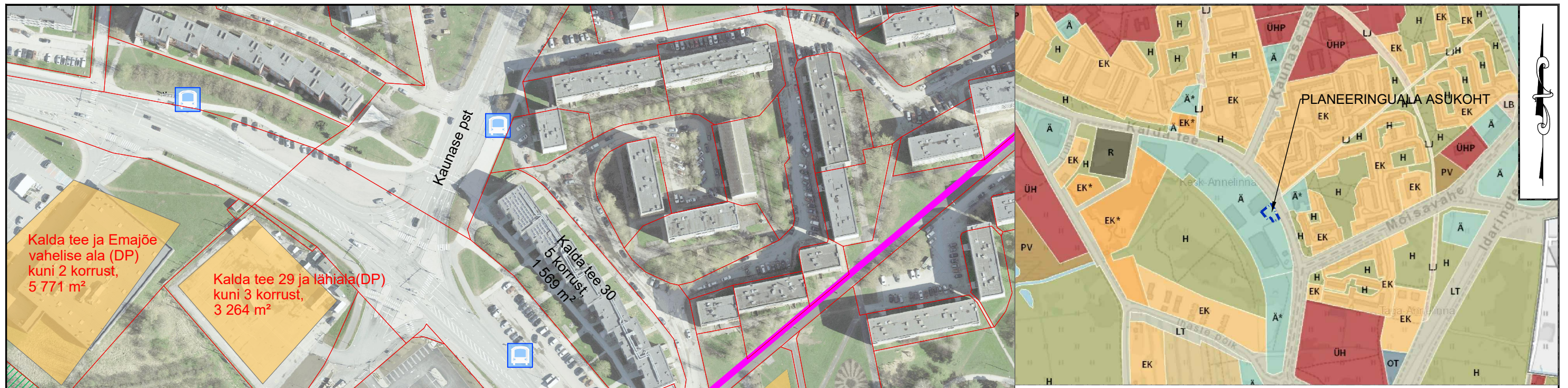
TARTU LINNA ÜLDPLANEERINGU MAAKASUTUSTINGIMUSTE KAARDI VÄLJAVÕTE

Kalda tee ja Emajõe vahelise ala (DP) kuni 2 korrust, 5 771 m 2